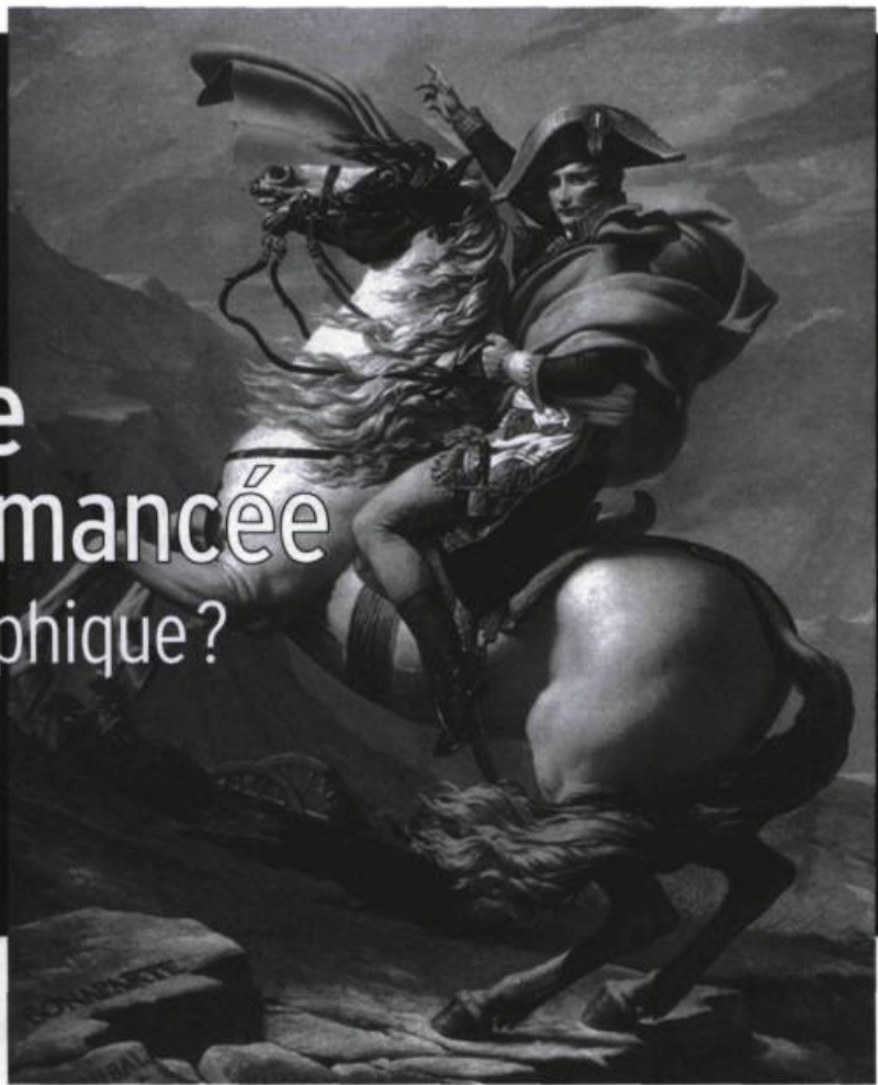
BONAPARTE (JACQUES-LOUIS DAVID, 1801)

Quand, au début des années quatre-vingt-dix, je cherchais une niche pour produire de la littérature jeunesse, l'espace était plutôt restreint. Plusieurs maisons importantes avaient leur propre collection de romans pour la jeunesse : La courte échelle, Héritage, Pierre Tisseyre, HMH Hurtubise, Chouette, Phidal, Québec Amérique, Boréal. Je me disais qu'il fallait trouver autre chose. Et c'est après avoir fait mon enquête et, surtout, avoir consulté Communication Jeunesse que l'idée d'orienter mes publications destinées à la jeunesse (les ados en particulier) du côté de l'histoire a pris forme. Mon choix de publier des biographies a été reçu avec enthousiasme. D'entrée de jeu, on a vanté les qualités de la collection en insistant sur sa pertinence. Quelle heureuse initiative, clamait-on. À ceux qui me félicitaient, j'ai toujours répondu que l'idée ne venait pas de moi, qu'elle existait depuis fort longtemps. De fait, j'avais lu plusieurs biographies dans ma jeunesse. Elles étaient publiées en général par des maisons d'édition religieuses. Ces livres avaient constitué une partie de mes lectures.