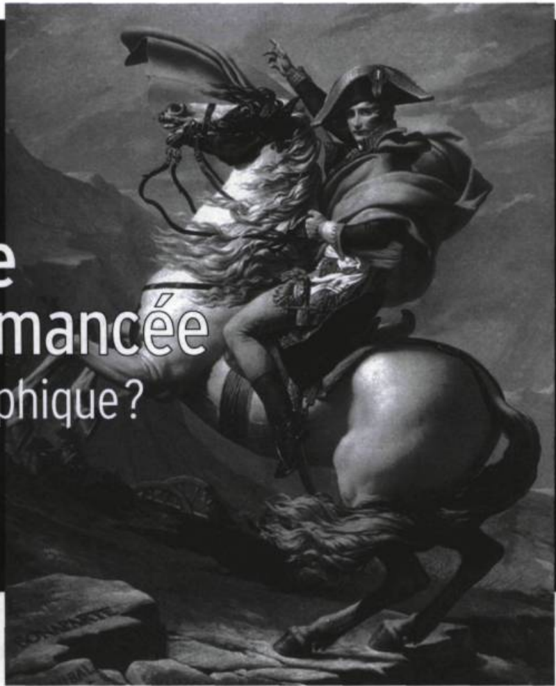
BONAPARTE (JACQUES-LOUIS DAVID, 1801)

Quand, au début des années quatre-vingt-dix, je cherchais une niche pour produire de la littérature jeunesse, l'espace était plutôt restreint. Plusieurs maisons importantes avaient leur propre collection de romans pour la jeunesse : La courte échelle, Héritage, Pierre Tisseyre, HMH Hurtubise, Chouette, Phidal, Québec Amérique, Boréal. Je me disais qu'il fallait trouver autre chose. Et c'est après avoir fait mon enquête et, surtout, avoir consulté Communication Jeunesse que l'idée d'orienter mes publications destinées à la jeunesse (les ados en particulier) du côté de l'histoire a pris forme. Mon choix de publier des biographies a été reçu avec enthousiasme. D'entrée de jeu, on a vanté les qualités de la collection en insistant sur sa pertinence. Quelle heureuse initiative, clamait-on. À ceux qui me félicitaient, j'ai toujours répondu que l'idée ne venait pas de moi, qu'elle existait depuis fort longtemps. De fait, j'avais lu plusieurs biographies dans ma jeunesse. Elles étaient publiées en général par des maisons d'édition religieuses. Ces livres avaient constitué une partie de mes lectures.