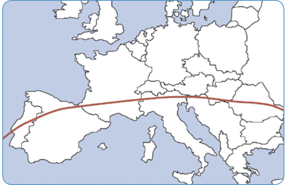
Figura 2b: Dermacentor reticulatus se encuentra en la zona punteada de azul, encontrándose la mayor frecuencia por encima de la línea roja

Figura 2a: Rhipicephalus sanguineus es principalmente una garrapata del sur de Europa: en el mapa, debajo de la línea roja, aparece señalada la zona donde se encuentra con mayor frecuencia