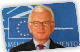
Hans-Gert PÖTTERING předseda EP