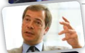
Nigel Paul FARAGE spolupředseda Skupiny nezávislých/ demokracie