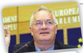
Jens-Peter BONDE spolupředseda Skupiny nezávislých/ demokracie