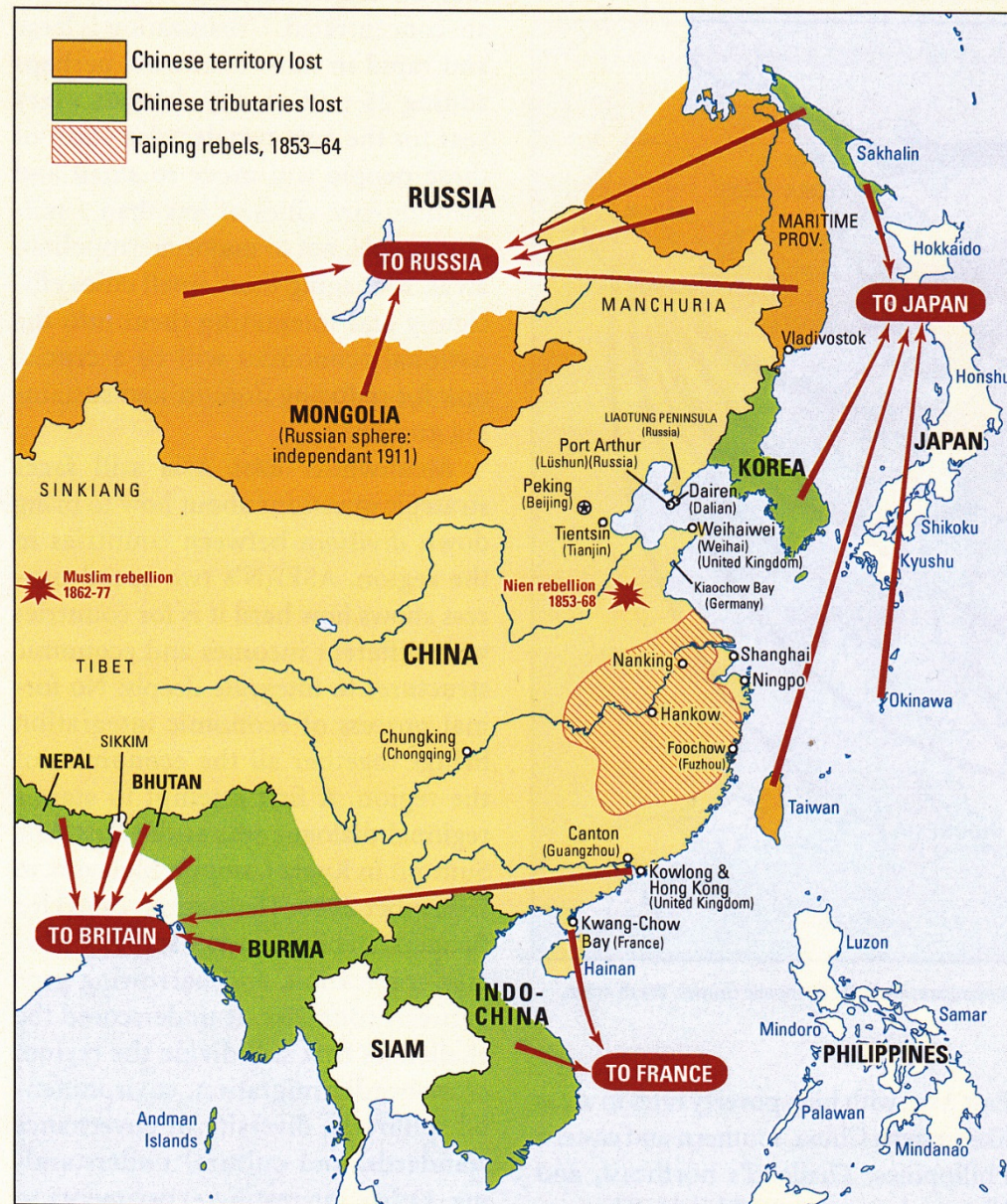
Map G3.1 Asia divided: conflict in the middle of the nineteenth century

- rewolucja 1949: Chińska Republika Ludowa, 1978: reformy Denga, 1989: nacjonalizm ideologią KPCh