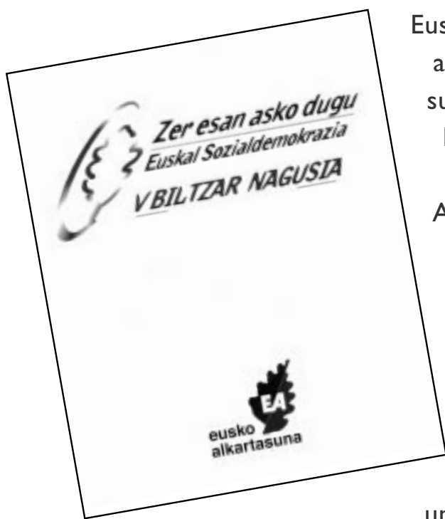
Ejemplar que reúne las ponencias aprobadas en el último Congreso celebrado el pasado noviembre en Iruña. Los textos están también a disposición de los interesados en la página web de EA: www.euskoalkartasuna.es

Eusko Alkartasuna fue el primer partido abertzale en poner encima de la mesa su propuesta concreta de avance hacia la soberanía. En el mes de noviembre del 99, el V Congreso de Eusko Alkartasuna, celebrado en Iruña, aprobó la ponencia política que recoge la estrategia a desarrollar para la consecución del tal fin, y que posteriormente se ha visto plasmada en otros textos, como el programa electoral de los comicios generales del 2000. ALKARTASUNA ofrece una síntesis elaborada a partir de algunos de esos textos y que recoge las líneas generales de esa propuesta.