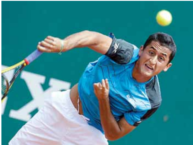
Nicolás Almagro venció a su compatriota Pablo Andujar en segunda ronda del torneo en Barcelona.