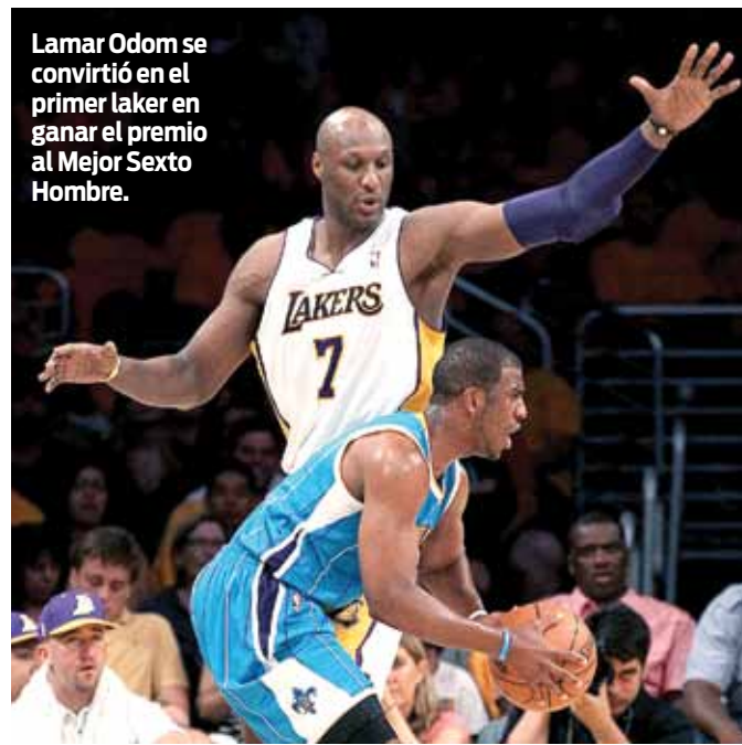
Lamar Odom se convirtió en el primer laker en ganar el premio al Mejor Sexto Hombre.