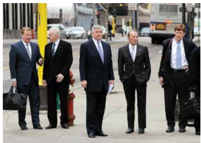
Roger Goodell (ext.izq.), Jerry Jones, Jerry Richardson, Pat Bowlen y Mark Murphy, representaron a la NFL en la reunión.

Búfalo jugaría un partido de temporada regular en Toronto, recibiendo a Pieleros de Washington el 30 de octubre.