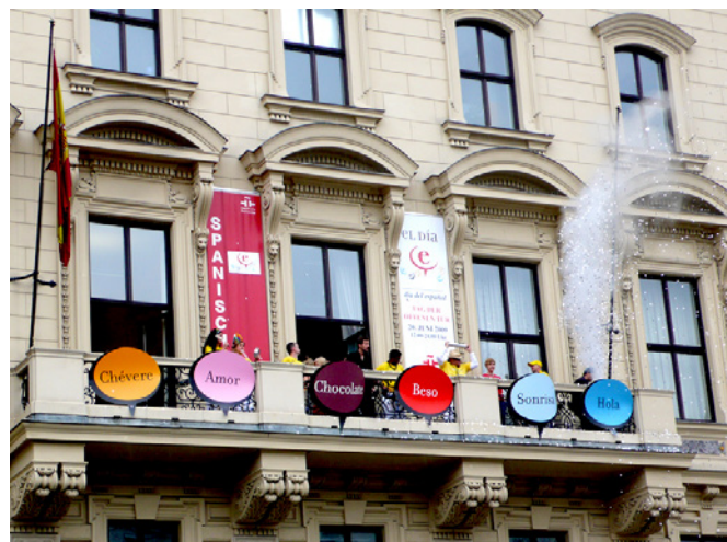
Fachada del Instituto Cervantes de Viena

Dichos turistas buscan tradicionalmente el sol y la playa, pero el turismo activo vinculado a la práctica de deportes como el golf, el senderismo o el ciclismo, el contacto con la naturaleza o el denominado "slow tourism" junto al turismo urbano, continúan creciendo progresivamente. España continúa siendo uno de los destinos favoritos, en la quinta posición entre los preferidos por los austríacos, con una cuota de mercado en torno al 7.4% por detrás de Italia, Croacia,