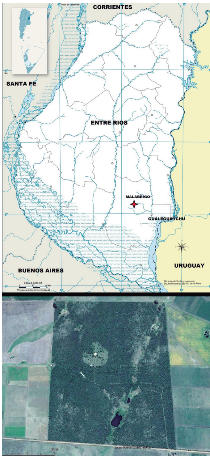
Figura 1- Ubicación geográfica de Malabrigo y vista aérea del área de estudio.