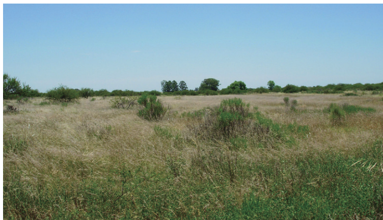
Figura 2 - Pastizal en Diciembre de 2007.

Todas las fotografías fueron tomadas por el autor en la reserva y en Liebigh, más una de Uruguay.