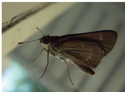
Figura 12 - Cymaenes tripunctus theogenis .

Rara, se hallaron solamente dos ejemplares dentro de la casa, los cuales habían entrado accidentalmente al estar las ventanas abiertas, en el sexto relevamiento (Figura 12). Contaba con citas solo para la provincia de Misiones (Hayward, 1973) pero de seguro se debe a que ha sido subobservada dada su apariencia y hábitos. Según Biezanko y Mielke (1973), en Río Grande do Sul (Brasil) es común en huertos y claros de bosques.