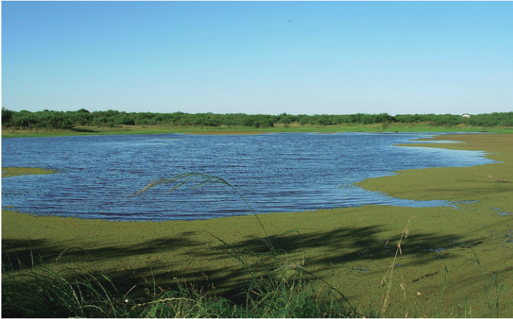
Figura 4 - Laguna principal en Diciembre de 2014.

Los nombres científicos y el orden sistemático siguen a de Warren et al. , (2015). Los nombres vulgares siguen los establecidos en Núñez Bustos (2010) y Klimaitis & Núñez Bustos (en prensa). Los ejemplares que fueron colectados están depositados en la colección ENB, del laboratorio Barcode, del Museo Argentino de Ciencias Naturales (MACN), Ciudad de Buenos Aires.