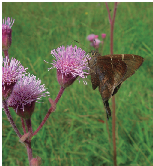
Figura 9 - Urbanus zagorus en flores de Campuloclinium macrocephalum .

Muy común en el campo solo en el primer relevamiento. No es muy frecuente aunque se ha hallado en Ceibas y en el PN El Palmar y alrededores (E. Núñez Bustos, obs. pers. ) (Figura 9). En el norte de la provin-