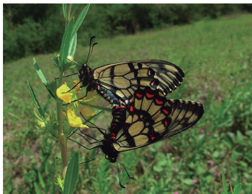
Figura 5 - Pareja de Euryades corethrus .

Común, hallada especialmente en los pastizales del este de la reserva en los pri-