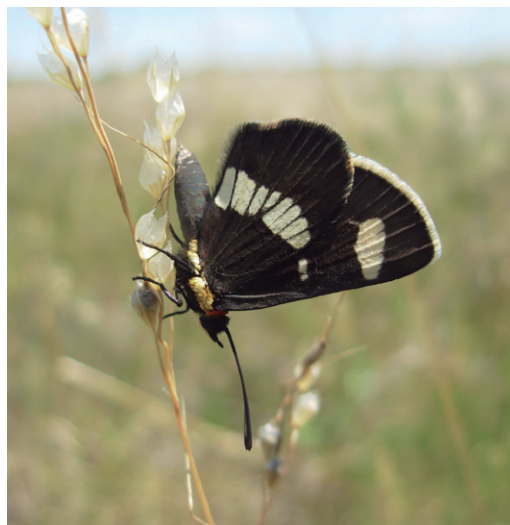
Figura 7 - Lemonias albofasciata en pastizal.

plares en pastizales (en noviembre 2007 y 2013), los cuales posaban en briznas de hierbas y flores minúsculas con las alas cerradas o semiabiertas (Figura 7). Solo presente en pastizales en buen estado de conservación de Entre Ríos, Corrientes y Córdoba (Hayward, 1973). Es posible en un futuro cercano ya no se halle aquí pues los pastizales están en retracción en la reserva por causas naturales.