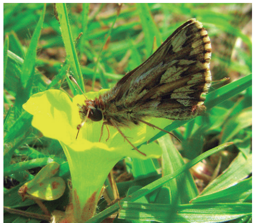
Figura 11 - Appia appia sobre Oxalis en Uruguay.