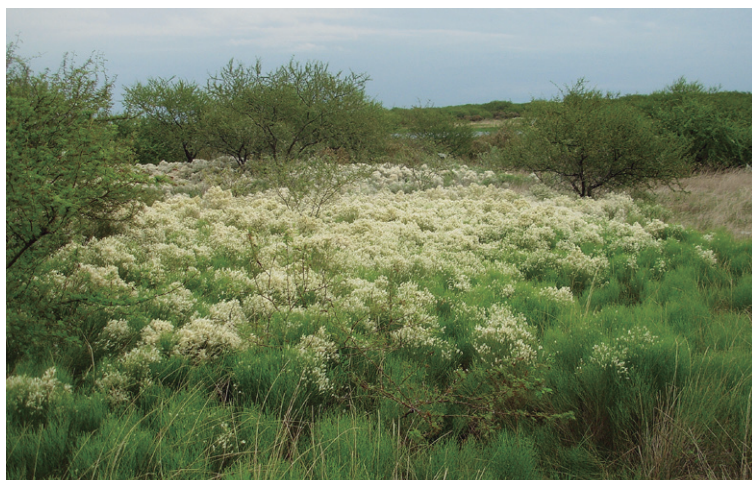
Figura 3 - Matorral de Baccharis en Abril de 2010.