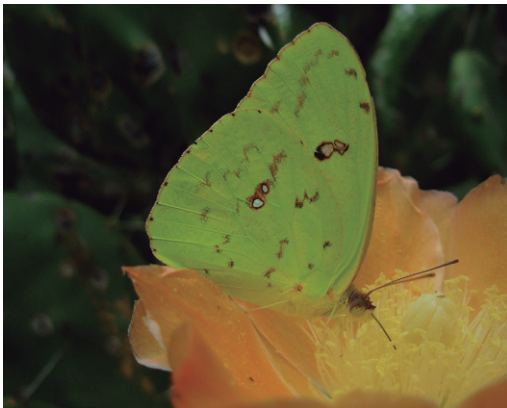
Figura 6 - Phoebis sennae marcellina en Opuntia elata .

Común, vuela en áreas abiertas y posa en flores de tuna ( Opuntia elata ) (Figura 6) y del sen del campo ( Senna corymbosa ), donde desova. Es la especie del género más frecuente localmente.