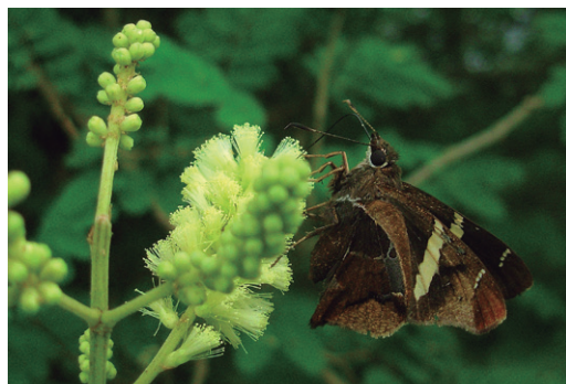
Figura 8 - Oechydrys chersis en flores de Acacia bonaerensis .

Oechydrys chersis chersis (Herrich-Schäffer, 1869) Fajada de Matorral