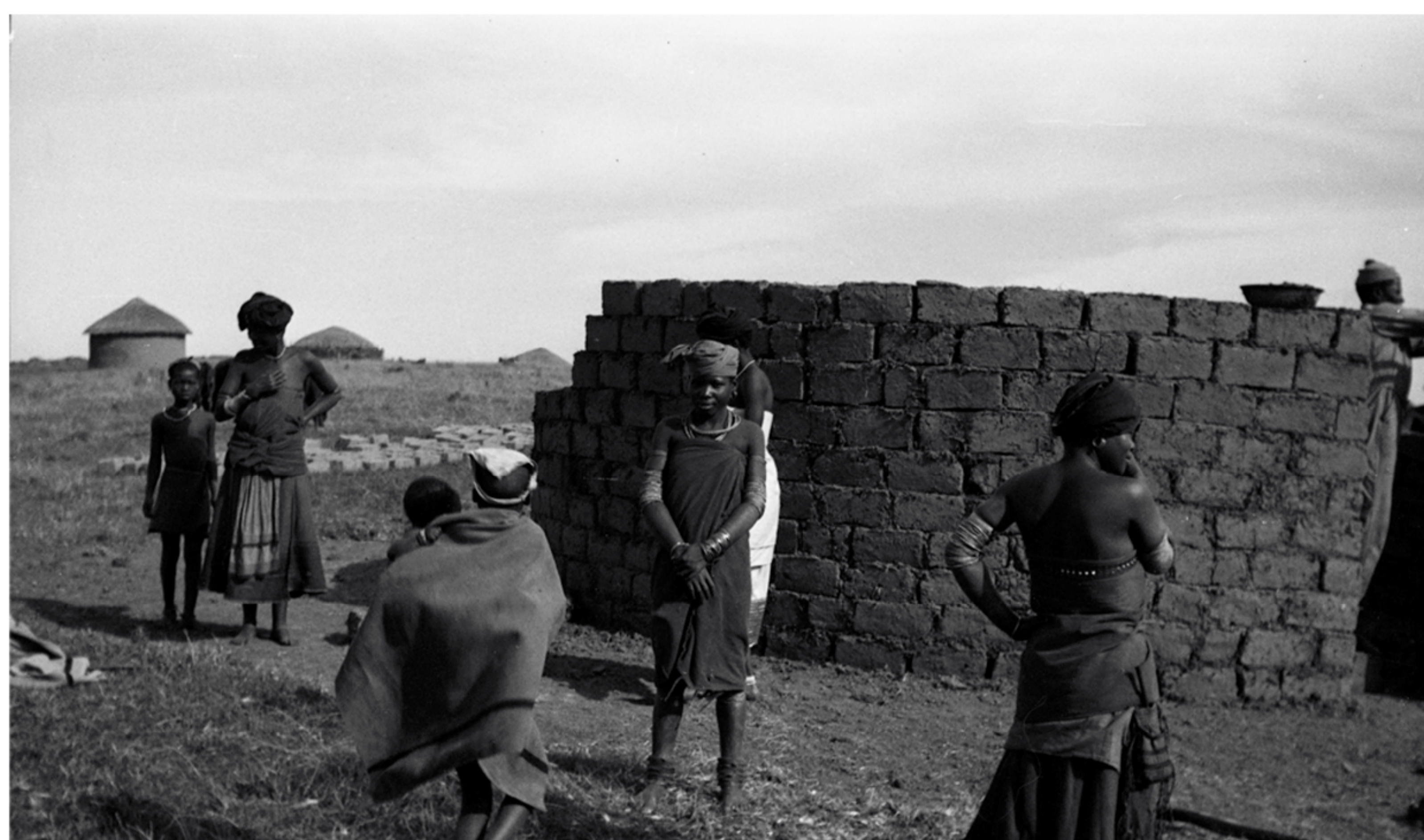
Jihoafrická unie, Kafrové v Mendu • South African Union, Kafa in Mendu (1948)

Dnes, po 70 letech od opuštění kapského přístavu, jih Afriky nadále zůstává světem nekompromisních paradoxů. Apartheidní režim, jenž zemi sužoval 40 let, zanechal nesmazatelnou stopu v myslích i srdcích všech místních bez ohledu na barvu pleti a jazyk, kterým mluví. Překonání hluboce zakořeněných rozdílů představuje výzvu, se kterou se soudobá Jihoafrická republika vyrovnává jen s nemalými obtížemi.