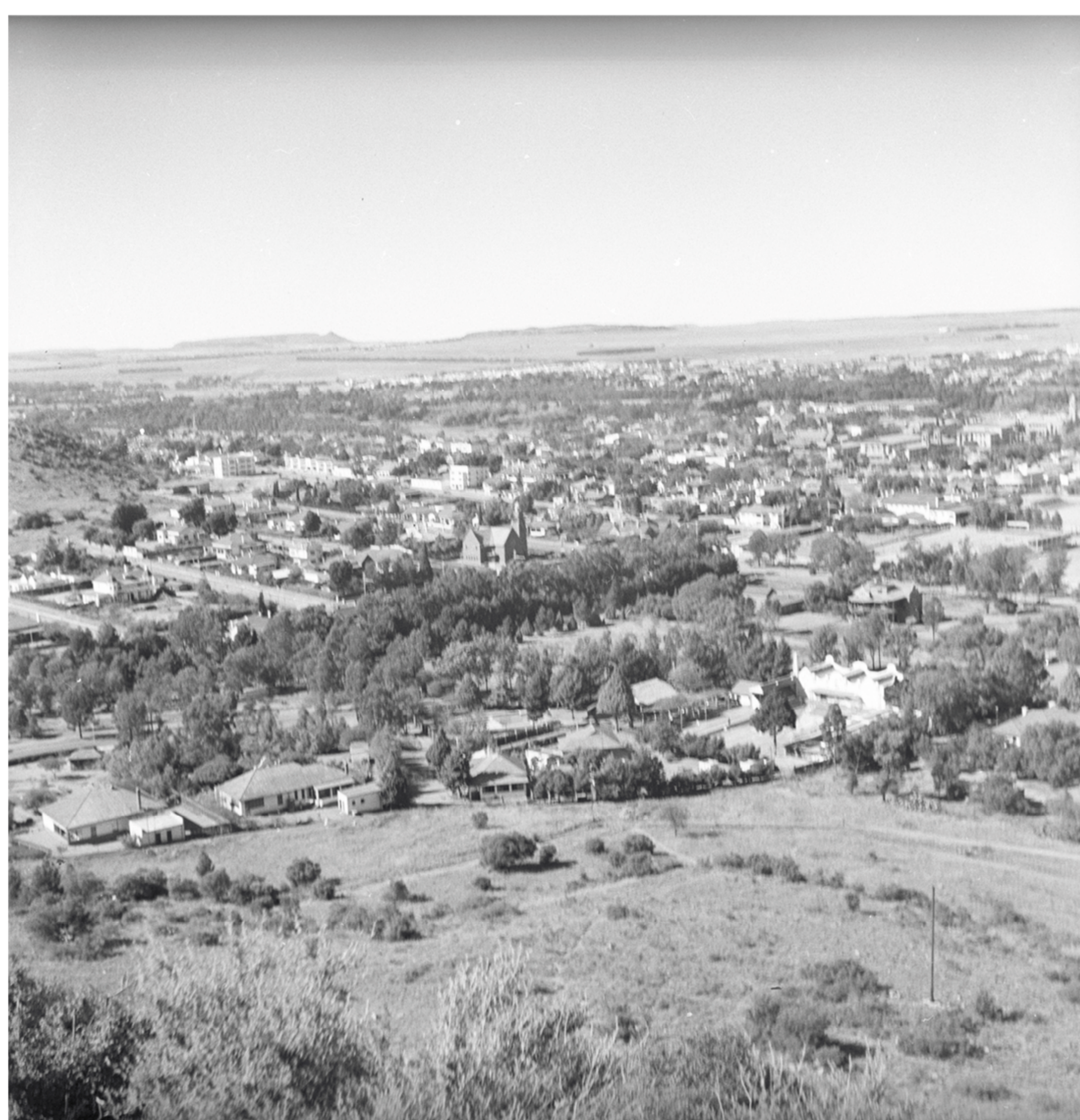
Jihoafrická unie, pohled na Bloemfontein • South African Union, Bloemfontein view (1948)