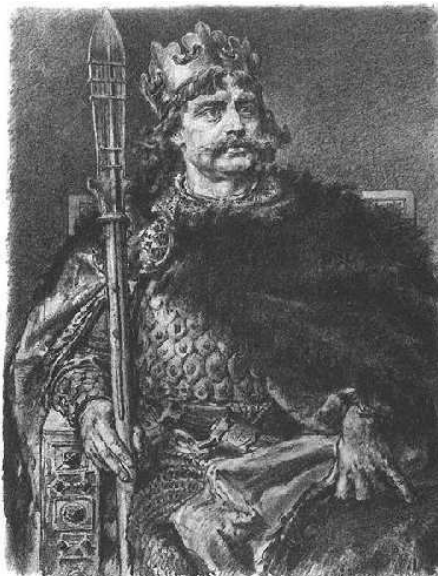
Boleslav I. Chrabrý