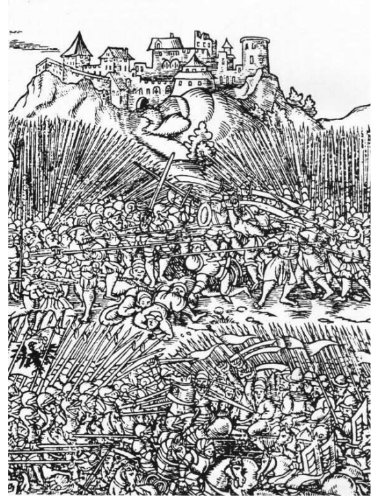
Bitka pri Grunwalde

Príslušníci tohto rádu sa snažili dobyť aj niektoré poľské a litovské územia. Toto neustále súperenie sa skončilo až v ..... storočí. Poliaci a Litovci nakoniec nad Nemeckými rytiermi zvíťazili a získali tak voľný prístup k moru.