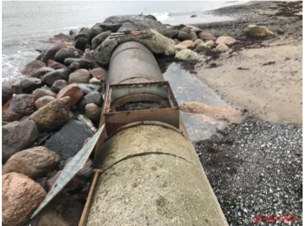
Rørlægningen der ønskes fjernet, ved siden af ses stensikringen der forbliver (Foto af d. 30. november 2021)