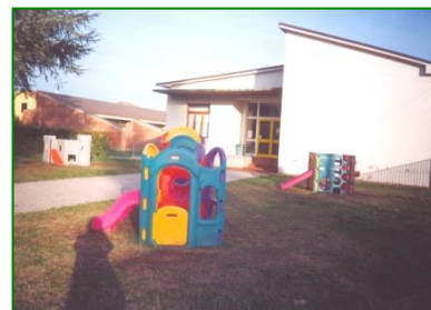
Nuova sede scuola dell'infanzia Sorbano