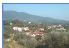
Vicopelago e S. Michele in Escheto