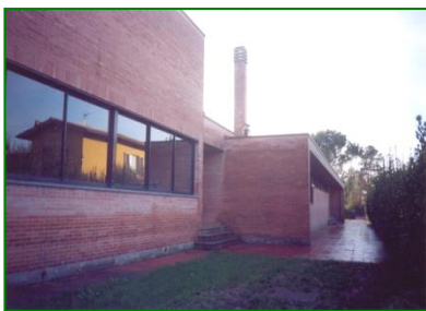
Nuovo edificio scuola primaria Sorbano

La scuola dell'infanzia di Sorbano del Vescovo si trasferisce nella nuova sede: l'ex scuola elementare; e, da questo momento, accoglie tre sezioni.