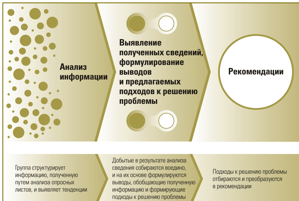
Рисунок 8. От анализа к рекомендациям

последствия всех представленных предположений, особенно в тех случаях, когда они противоречат друг другу.