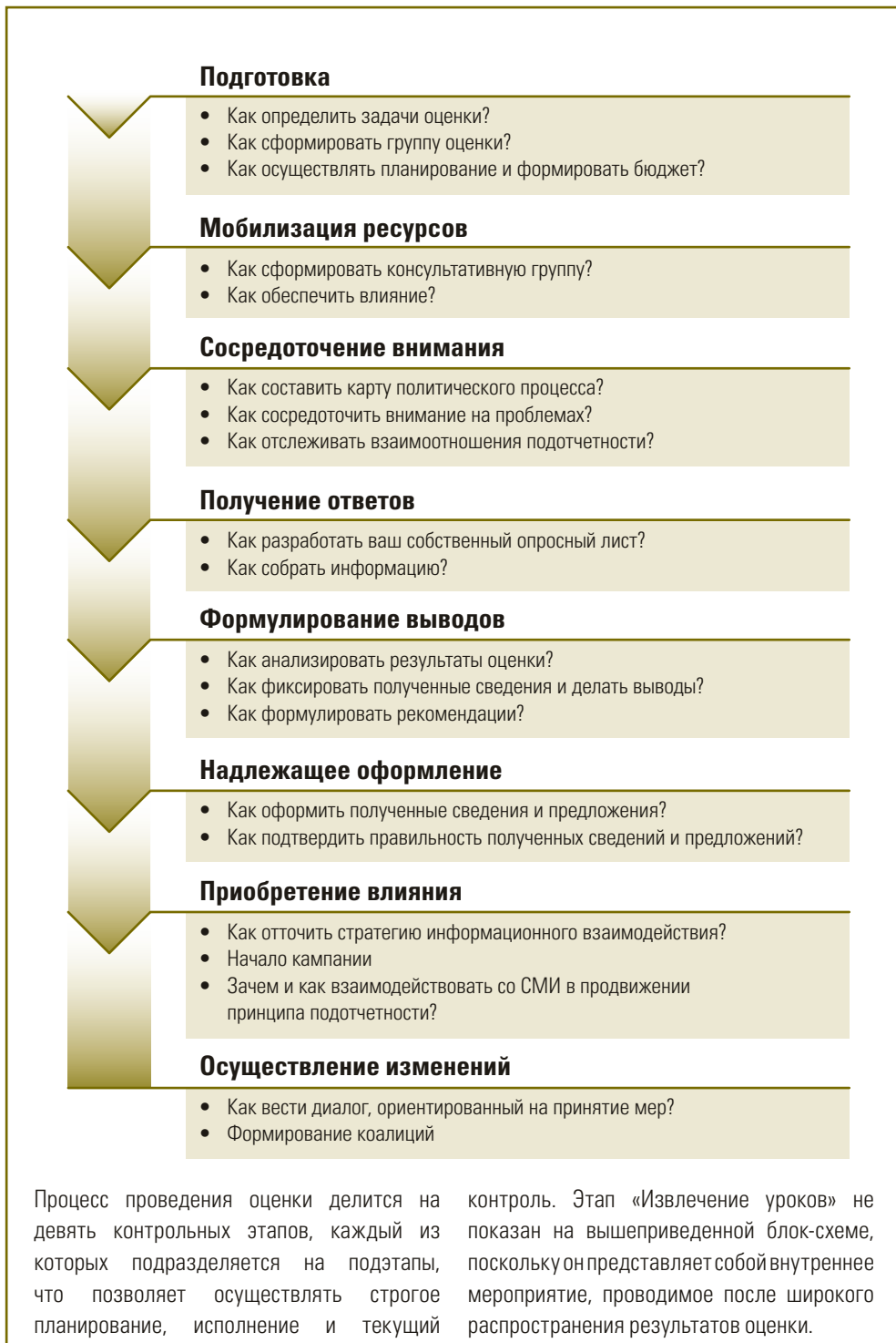
Рисунок 3. Процесс проведения оценки