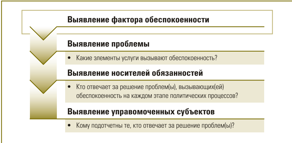
Рисунок 5. Выявление фактора беспокойности