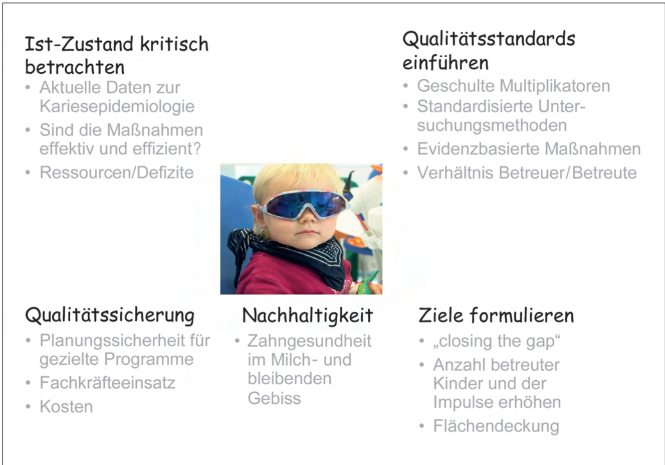
Abbildung 1 Good-Practice-Betreuungs-Setting für 3- bis 5-Jährige im Rahmen der Gruppenprophylaxe.