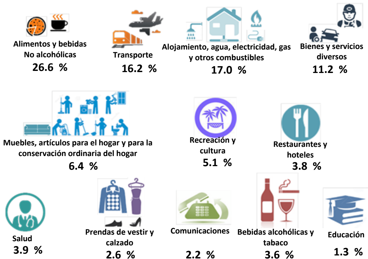
Gráfica 2 CONSUMO FINAL DE LOS HOGARES Y DE LAS INSTITUCIONES PRIVADAS SIN FINES DE LUCRO POR FINALIDAD DURANTE 2021

* El rubro de bienes y servicios diversos incluye: los cuidados personales, efectos personales, seguros y servicios financieros, entre otros.