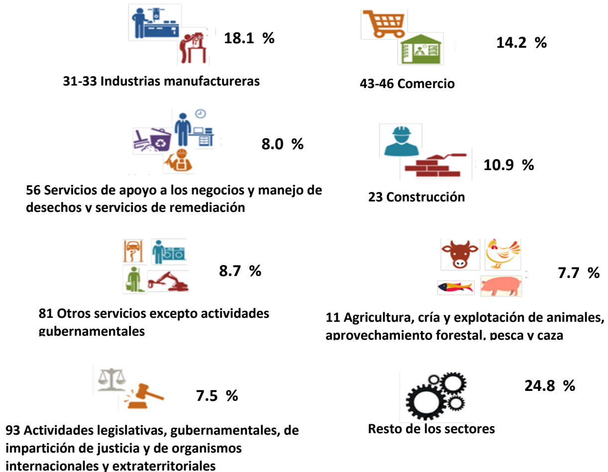
Gráfica 4 PUESTOS DE TRABAJO OCUPADOS REMUNERADOS, DEPENDIENTES DE LA RAZÓN SOCIAL DURANTE 2021

Nota: La suma de los parciales puede no coincidir con el total debido al redondeo.