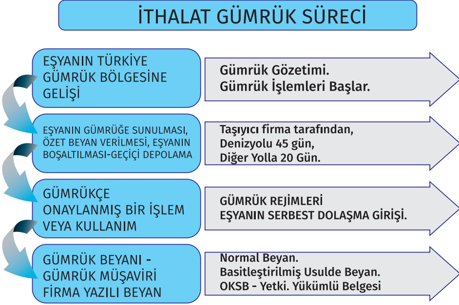
Şekil 6; İthalat Gümrük Süreci-2