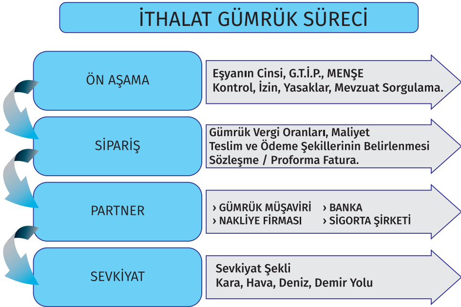
Şekil 5; İthalat Gümrük Süreci-1

Gümrüğe gelen ithal eşyası ile ilgili olarak; malın cinsi, adeti, ağırlığı, menşei, Gümrük Tarife İstatistik Pozisyonu konusunda tereddüt yaşanırsa, cezaya düşmemek için 4458 sayılı Gümrük Kanunu'nun 8.maddesine istinaden bilgi talep etme hakından yararlanılır. Yapılması gereken malın geldiği ilgili gümrük idaresine yazılı başvuru ile gümrük mevzuatının uygulanması hakkında bilgi talep edilebilir. Bilgiler talep eden kişiye ücretsiz olarak verilir. İhtiyaç duyulan bilgiler öğrenilir, gelen eşya ile ilgili tereddütler giderilir, doğru bilgilerle gümrüğe beyanda bulunulur.