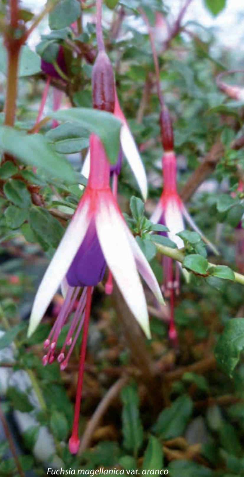
Fuchsia magellanica var. aranco