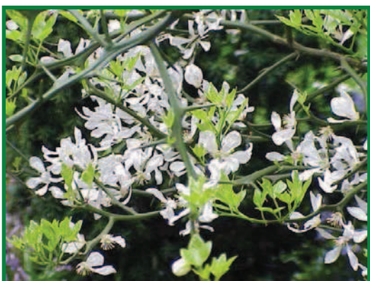
Figura 4. Género Poncirus