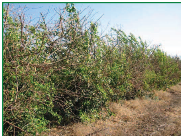
Figura 8. Síntomas, marchitez repentina de ramas.