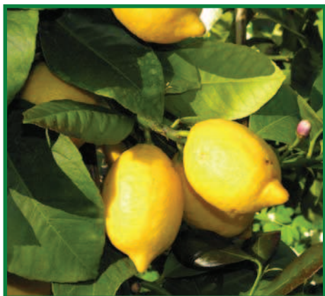
Figura 2. Género Citrus

Entre los patrones susceptibles se encuentra el limón rugoso, limetta, Macrophylla , naranjo amargo y citrangs Troyer y Carrizo.