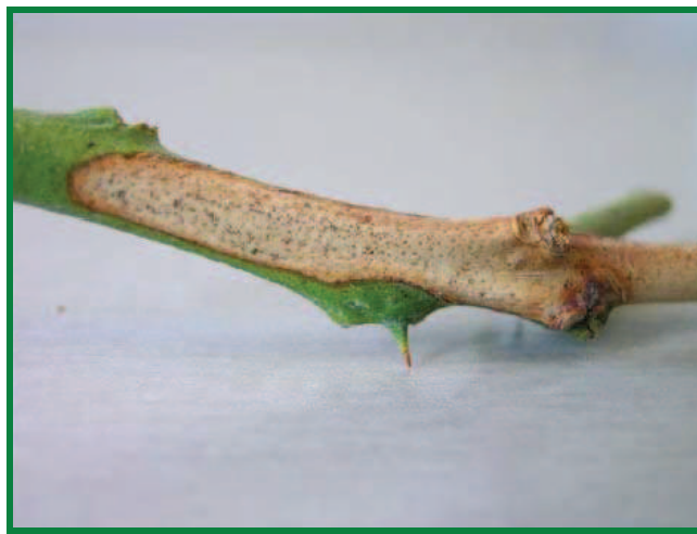
Figura 7. Síntomas, rama de color gris cubierta de picnidios.