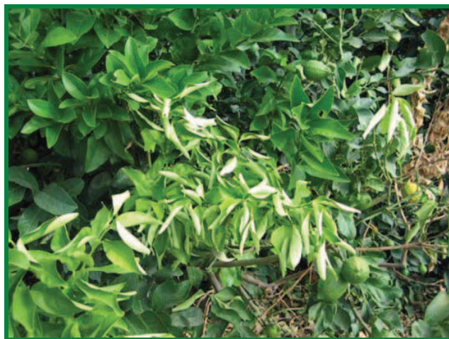
Figura 9. Síntomas, hojas cloróticas y marchitamiento de ramas.