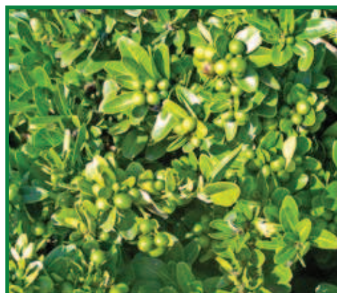
Figura 5. Género Severinia