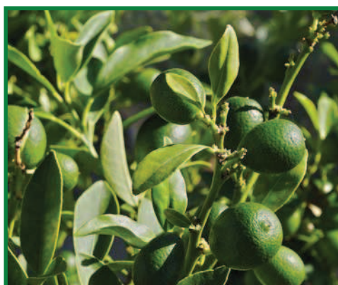
Figura 3. Género Fortunella