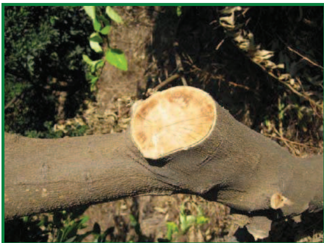
Figura 6. Síntomas, color naranja-salmón en xilema.

En adición a la forma más común del mal seco de los cítricos, se pueden distinguir dos formas diferentes de la enfermedad: " Mal fulminante ", que es una forma fatal y rápida de la enfermedad, aparentemente debida a una infección radicular (Figura 8); y " Mal negro ", que es consecuencia de una infección crónica del árbol que conduce al pardeado del corazón de la madera.