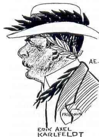
Bild 3. Svenska Adademiens ständige sekreterare tecknad av Albert Engström i Dikter av Erik Axel Karlfeldt, 1939.

Trädgården hölls väl tuktad, utom på ett ställe, där kungsljusen växer (bild 1). Namnet har växten fått av att man efter behandling kunde använda stjälkarna som facklor. Den är tvåårig.