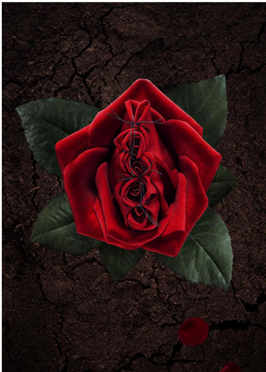
Den ihopsydda rosen från Amnesty Internationals information om kvinnlig könsstympning.