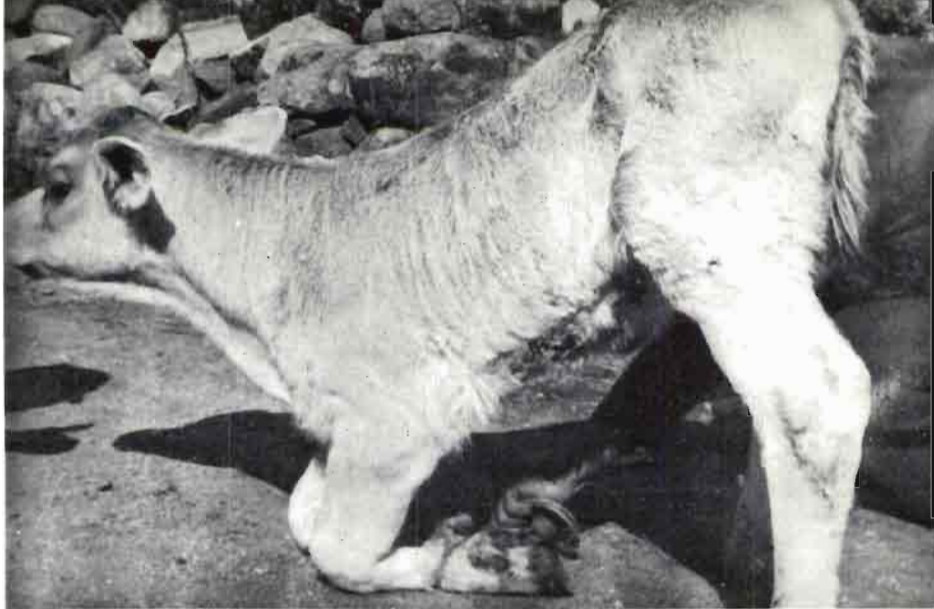
Fig. 3.—Ternero con síntomas de forma aguda en el proceso de la enfermedad.