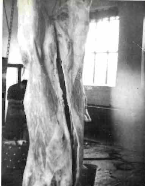
Fig. 4.—Aspecto de una canal de ternera.

cuadriles y lomos presentan un color más blanco que el resto de la canal, pero en conjunto toda la canal presenta un color blanquecino dando la sensación de carne de pescado.