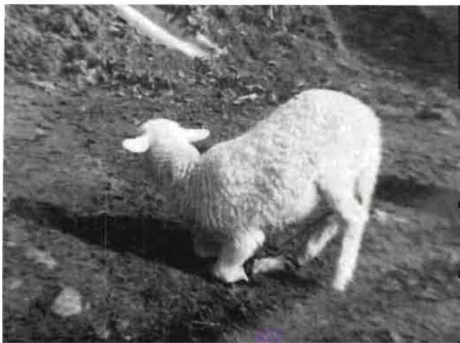
Fig. 6.—En corderos es recomendable la aplicación de vitamina E.

También se recomienda la administración de glucocorticoides (hidrocortisona a dosis de 500 miligramos o prednisona y prednisolona a dosis de 100 miligramos; ambas se aplican intramuscularmente porque son antiinflamatorios. De todas formas estos tratamientos deben ser establecidos y puestos en práctica siempre por el veterinario.