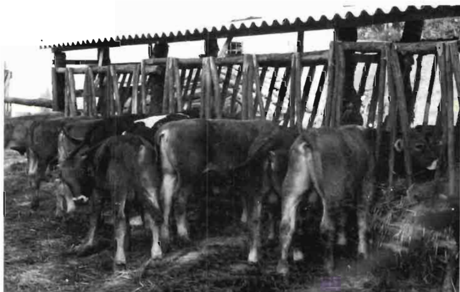
Fig. 1.—Lote de terneros de engorde.

En Francia se da en los rebaños de bóvidos de raza Charolesa y Limousina; asimismo ha sucedido con los rebaños de corderos que habitan en los Alpes, centro de Francia y la Costa del Oro, EE.UU., Nueva Zelanda y Suecia, etc.