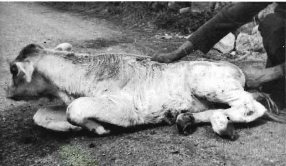
Fig. 2.—Los animales jóvenes de crecimiento rápido son los más frecuentemente afectados por «músculo blanco».

La enfermedad se manifiesta en todas las edades, pero en el 99 por 100 de los casos se da en animales jóvenes de rápido crecimiento, con cambios radicales en las condiciones de vida (destete, régimen de pastoreo, después de una larga estabulación, ejercicio excesivo, cambios bruscos de temperatura, etc.).