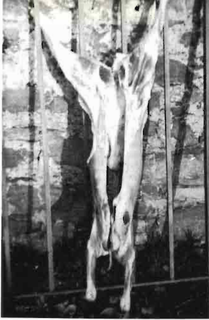
Fig. 5.—Aspecto blanquecino de una canal de ovino.

Una de las alteraciones más características es el color blanquecino que tienen los músculos maséters, es decir, los de los maxilares. Cuando estos músculos están afectados en la canal, se ha observado en el cuadro clínico que el animal no podía comer o no podía mamar, según la edad, y había caída de saliva por las comisuras bucales.