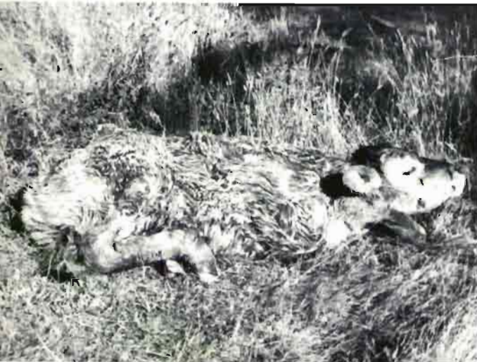
Fig. 7.—Ternero afectado por «músculo blanco».

Es muy conveniente proteger a los animales de la humedad y de los cambios bruscos de temperatura. Debe ponerse especial atención en los transportes, vacunaciones colectivas, maniobras que puedan representar un «stress» especialmente para los animales hipersensibles.