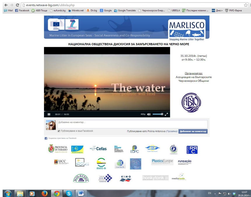
Снимка 4. Електронна платформа за онлайн гледане на форума

Форумът се излъчи пряко от Варна по БНТ2, като имаше възможност заинтересованите лица от цяла България да го наблюдават и онлайн в специално разработената за целта електронна платформа.