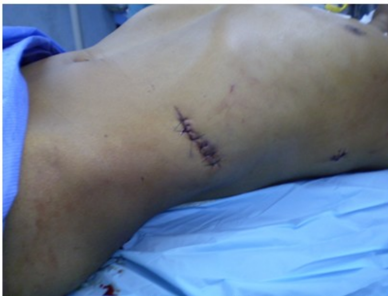
Figura 1. Paciente con herida toracoabdominal a nivel de línea axilar posterior en hemitórax izquierdo y herida subcostal izquierda.

Radiografía de tórax anteroposterior (AP): No se observaron alteraciones pleuro pulmonares.