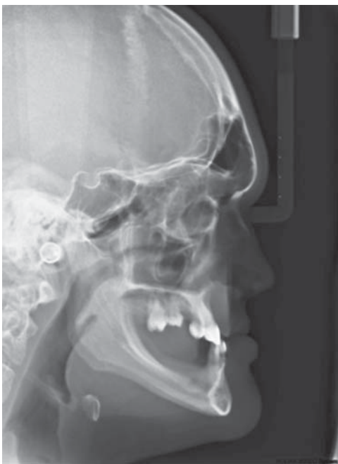
Figura 2. Radiografía lateral mostrando ausencia del proceso alveolar en regiones edéntulas de maxila y mandíbula.

El paciente fue sometido a documentación radiográfica inicial, obteniéndose radiografías panorámicas,