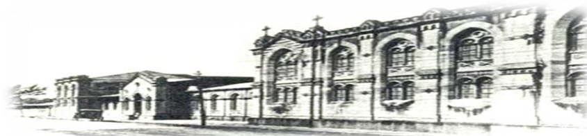
Hospital San Juan de Dios, San José, Costa Rica. Fundado en 1845