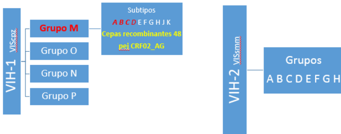
Figura 4. Clasificación del VIH1 y VIH2