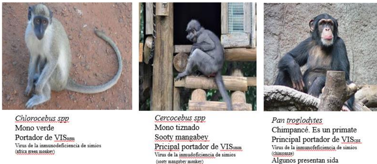
Figura 2. Monos africanos asociados al VIH/SIDA