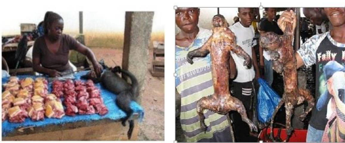
Figura 3. Comercio con monos en un mercado de África Occidental