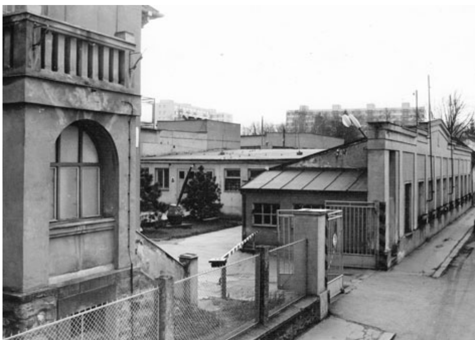
Vstupní brána podniku GAMA Milevsko z 80. let 20. století. Ze sbírek Milevského muzea.