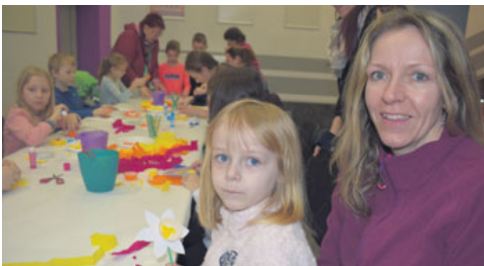
Ve středu o jarních prázdninách proběhla v Milevském kině tvořivá dílnička spojená s promítáním pohádky Zdeňka Trošky Zakleté pírkó.