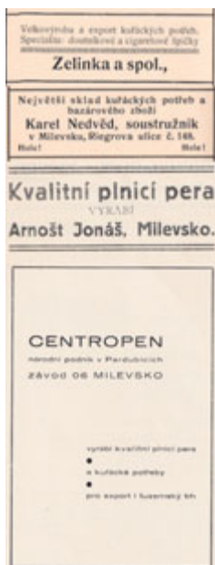
Soubor dobových inzerátů z tisku.