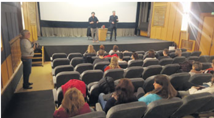
Ve středu 11. března pořádala Městská knihovna v Milevsku další z oblíbených Listování, tentokrát o knize Jak se stát diktátorem. Herci zapojili do děje i odvážné publikum.