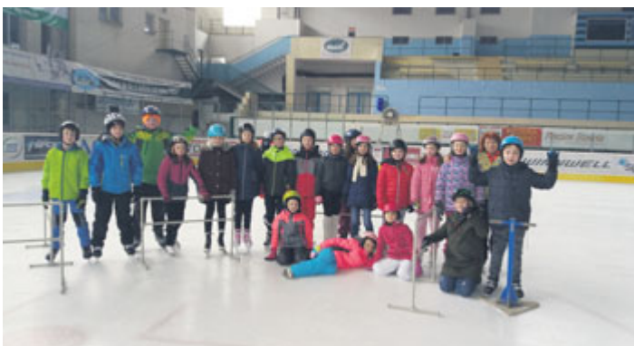
I děti z 1. ZŠ Milevsko si hodiny tělesné výchovy zpestřily zimními sporty. Například žáci IV. B a IV. C prověřili své bruslařské dovednosti na zimním stadionu. O pády a modřiny nebyla nouze, ale přesto zažili spoustu legrace.