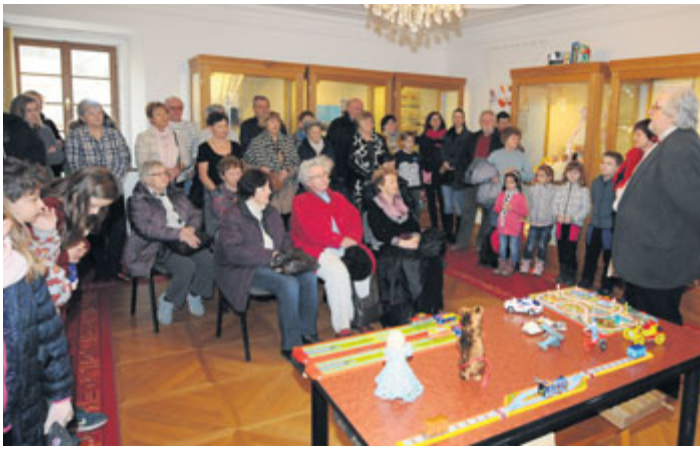
S velkou návštěvností se setkala vernisáž výstavy s názvem Hračky pro každý den, která proběhla v sobotu 7. března v Milevském muzeu. S ukončením výstavy se počítá v neděli 10. května, pro aktuální informace sledujte www.muzeumvmilevsku.cz .