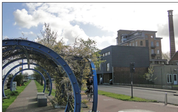
Promenade langs het water

Ook in Oostende werden kaaimuren langs het kanaal vernieuwd. Zitbanken, een verbreed fietspad en groen zorgen ervoor dat het veilig en aangenaam vertoeven is langs het water.