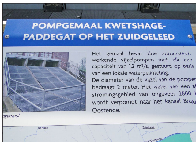
Infobord aan pompstation Kwetshage

Het gebied rond het kanaal is belangrijk landbouwgebied. Binnen de polders, waar het water trager afstroomt, wordt het waterpeil kunstmatig laag of hoog gehouden. In de winter en het voorjaar wordt het lager gehouden zodat de landbouwers hun akkers kunnen bewerken. In de zomer wordt een hoger waterpeil ingesteld, zodat dit water gebruikt kan worden als drinkwater voor het vee en om akkers te bevloeien. De landbouw is dus afhankelijk van dit