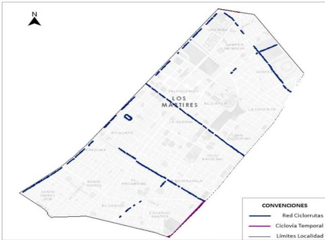
Ilustración 1. Red de Ciclorrutas de la Localidad de Los Mártires