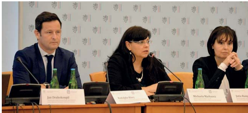
Ministryně Michaela Marksová moderovala jednu z diskuzí na konferenci o budoucnosti trhu práce.

V Černínském paláci v Praze se 25. listopadu konala mezinárodní konference, která řešila budoucí podobu pracovních trhů v evropském i celosvětovém kontextu.