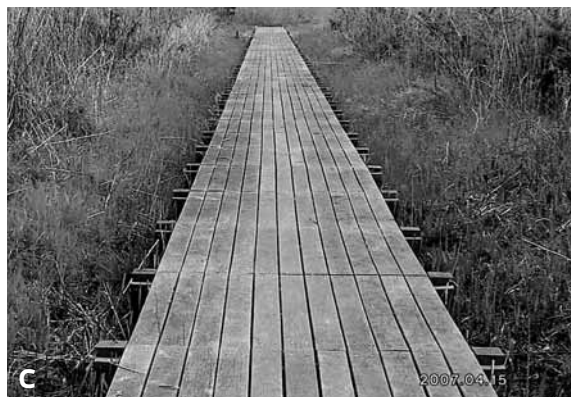
図1. 浮島地区の景観. a: 6月中旬の景観, b: 3月上旬の景観, c: 4月中旬の木道周辺.