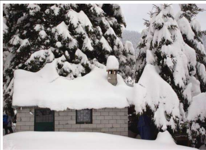
Όποιος θέλει να περάσει Χριστούγεννα με τέτοιες εικόνες ας ανέβει αυτές τις μέρες στο γενέθλιο τόπο μας, απάνω στ' Άγραφα.