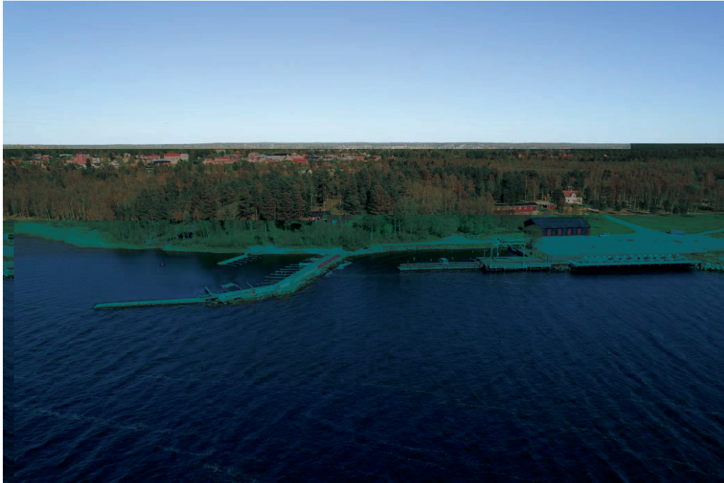
Hamnområdet norr om planområdet