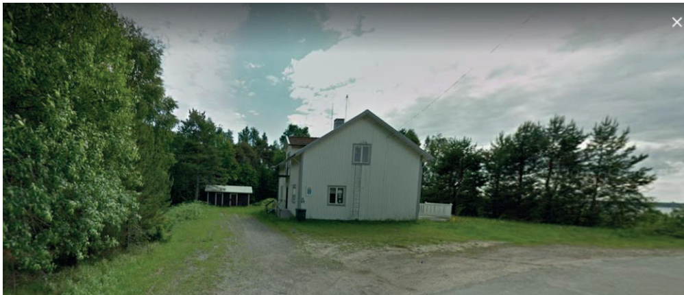
på det tidigare hamnkontoret

Planområdet är idag obebyggt men tidigare var planområdet bebyggt med en 1 ½ plans bostadsvilla med tillhörande förrådsbyggnad som på senare tid nyttjades som hamnkontor. Byggnaderna har nu rivits.