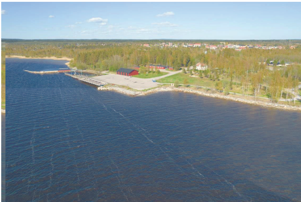
Flygbild över området.

Detaljplanen skapar förutsättningar för att området ska tas i anspråk för bostadsbebyggelse med bevarande av natur som parkmark. Områdets landskapsbild kommer att förändras främst från Bottenviken sett i och med att området kan bebyggas med ett punkthus upp till åtta våningar.