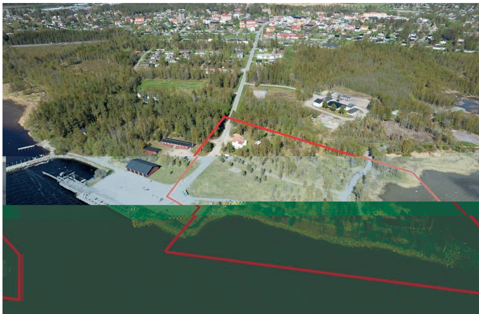
Översiktsbild. Den rödmarkerade ytan visar ungefärlig avgränsning för det föreslagna planområdet.

Fastigheterna ägs av Nordmalings kommun.