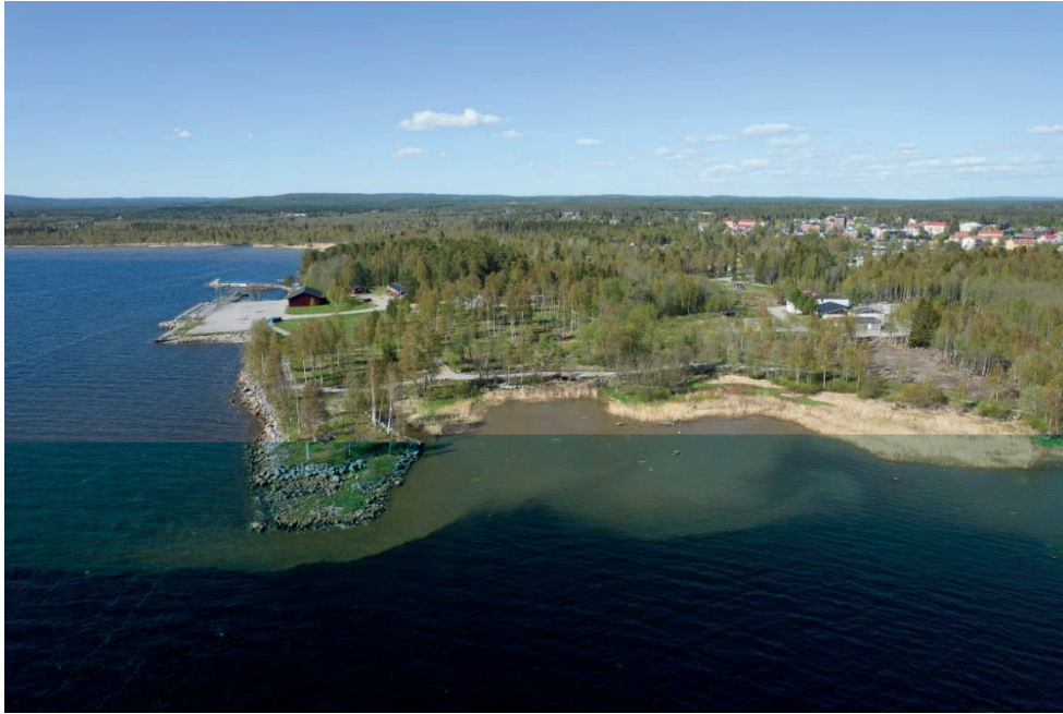
Flygbild från söder.