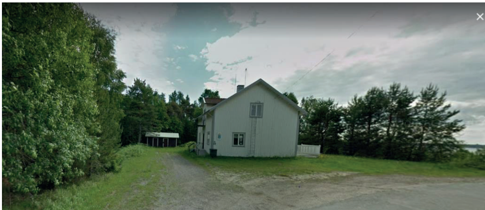
Bild ovan visar det tidigare bostadshuset och hamnkontoret som legat på platsen.

Sammantaget kommer planens genomförande att kraftigt öka, och långsiktigt säkra, områdets attraktion och tillgänglighet för allmänheten. Planförslaget ökar mängden obebyggd yta (park) utifrån gällande detaljplan, som säkerställer allmänhetens åtkomst och gröna ytor som även bidrar till växt och djurlivets åtkomst till vattenområdet.