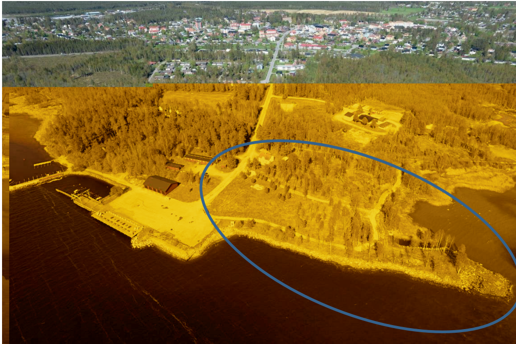
Flygbild från ovan. Markering visar ungefärligt planområde