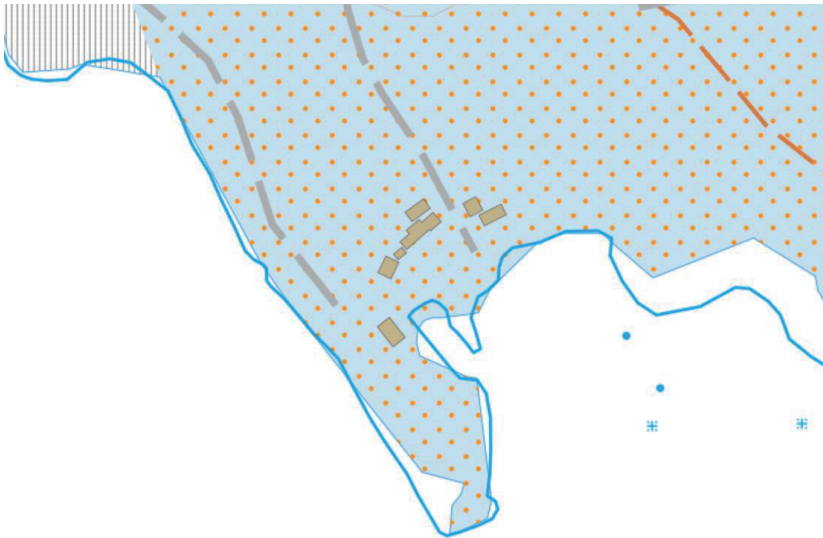
Utdrag från SGUs jordartskarta