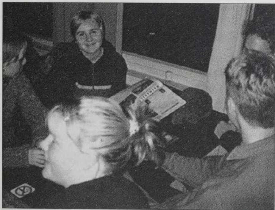
Lagsmøte i Studentmøllaget i Bergen

berre at ein hugsar på å senda ut studietilfang på førehand, og at nokon vert beden om å laga ei lita innleiing om emnet til møtet. Les meir om studiearbeid på side 35.