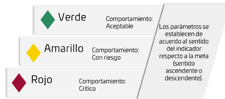
Ilustración 2. Términos de semaforización.

En términos generales los colores de semaforización se traducen de la siguiente manera (ver ilustración 2 ).