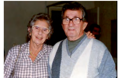
Bobath senar-emazteak, "Bobath kontzeptua"ren sortzaileak.

minimizatzeko itxaropenaz, baina kontuan hartu behar da terapia miresgarririk ez dagoela. Bobath teknikaren helburua funtzionaltasun egokia berreskuratzen laguntzea da. Horregatik, pazientearen parte-hartzea eta proposatutako ariketak eta gorputz jarrerak bakoitzaren bizitzan integratzea nahitaezkoa da.