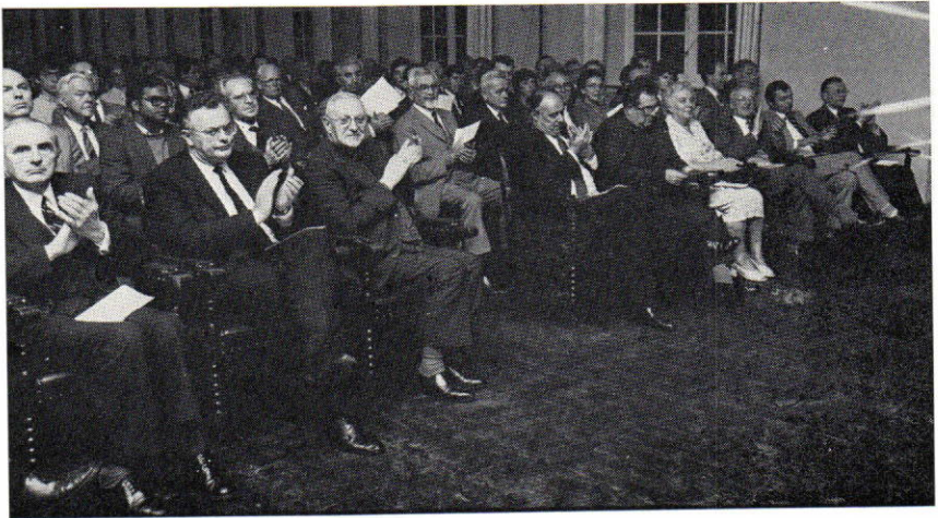
Veel volk en veel prominenten.