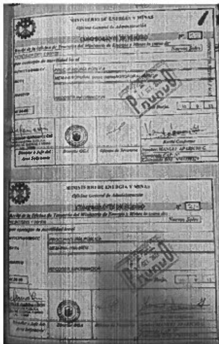
Imitaciones libres de firmas con rúbricas hechas sobre los ya existentes nombres del practicante, previamente impresos en cada comprobante.