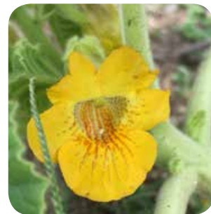
Flor con sus estrías de color