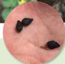
Semillas con protuberancias