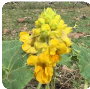
Racimo de flores