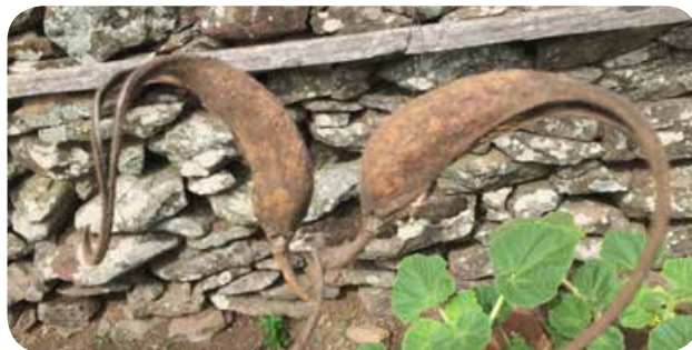
Frutos (uña del diablo)