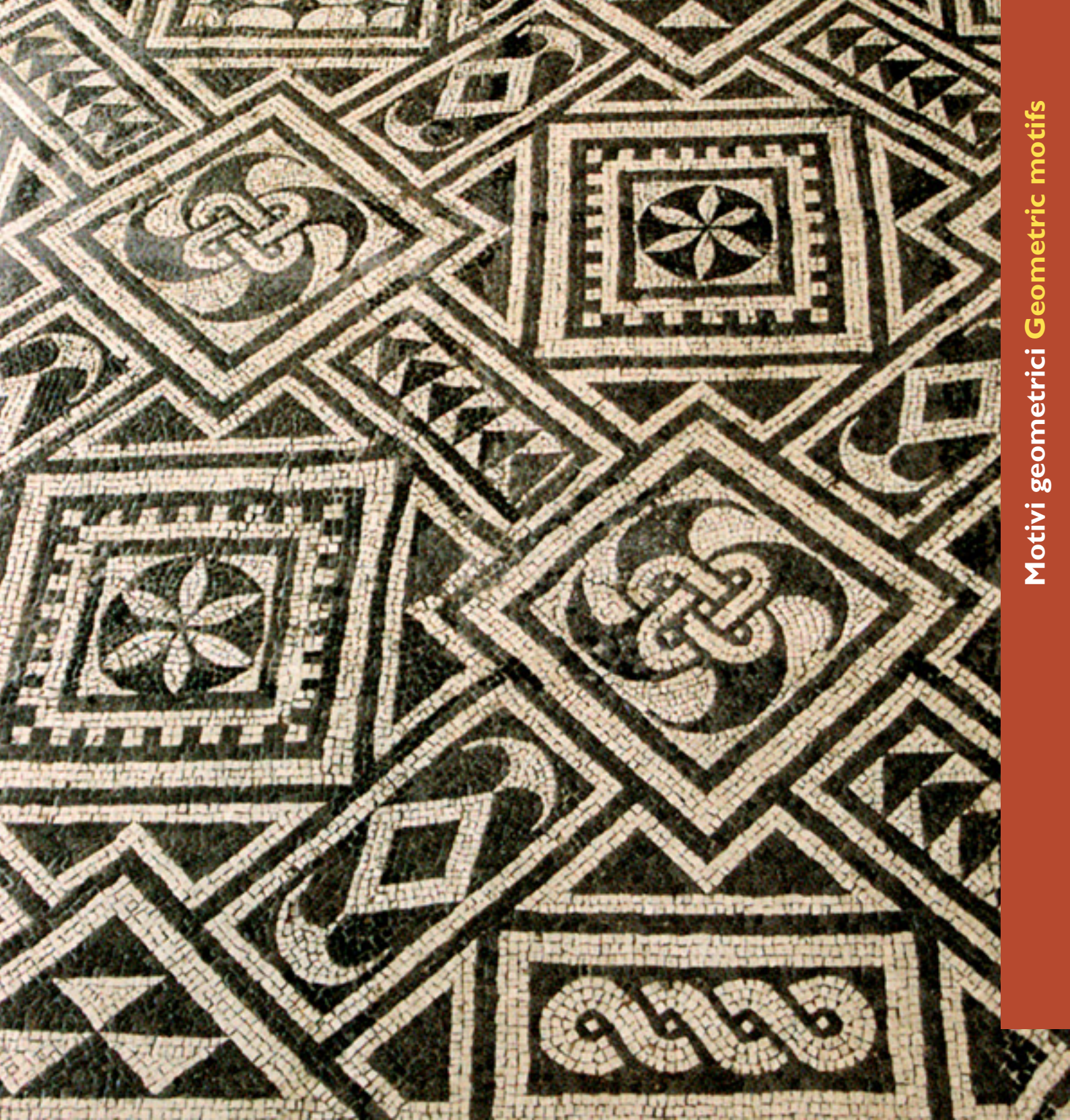
Motivi geometrici Geometric motifs