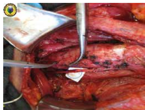
Figura 3. Tiroidectomía total con vaciamiento ganglionar central; se visualiza la reconstrucción del nervio laríngeo recurrente izquierdo con la técnica de Horsley (círculo azul).