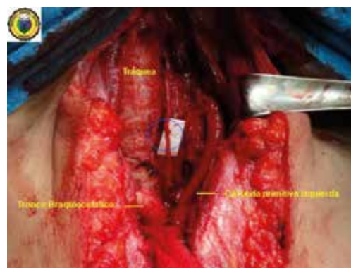
Figura 2. Se visualiza la reconstrucción del nervio laríngeo recurrente izquierdo con la técnica de Horsley (círculo azul).