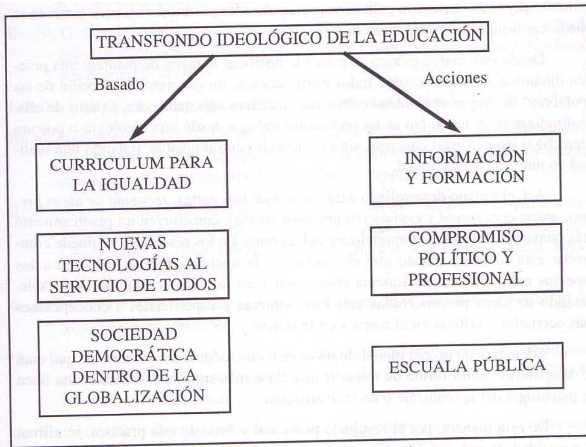
Cuadro 2: Mapa conceptual común de todo el grupo-clase.

En este trabajo, se expone el mapa conceptual común.