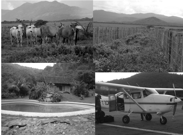
9. Los ocupantes criollos (terratenedientes) han causado daños graves (deforestación y devastación de los recursos naturales, restricciones al acceso y control de recursos, ocupación de territorios sagrados, etc.).

Pero por otro lado, esto también implica un reconocimiento del pro+ y de sus derechos. Los Yabarana hablan de su respeto por los Piaroa, Panare y Jotí, así como de su disposición a reconocer el derecho que estos también tiene sobre el territorio que comparten. Con ese firme propósito, es que han decidido llevar (a cabo) su proceso de autodemarcación de las tierras y hábitat, en términos multiétnicos. Ellos, han requerido de un reconocimiento de la diversidad cultural característica de la zona, así como de un distanciamiento con respecto a los no indígenas (terratenedientes, principalmente).