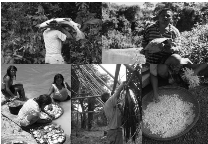
8. Los Yabarana mantienen una estrecha relación con su entorno natural

Los Yabarana mencionan las evidentes transformaciones que han sufrido los accidentes geográficos y las zonas de vida, en especial por la intervención humana. Asimismo, en cuanto a los recursos indican cómo estos han mermao a raíz de la llegada de agentes externos a la zona que han incrementado su explotación, a la vez que han introducido nuevas formas de uso y aprovechamiento de estos que no han sido favorables.