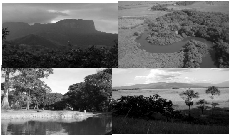
2. Sector Parucito- Manapiare, Municipio Manapiare, estado Amazonas

Por ello, han acatado pautas y procedimientos que, aún siéndoles ajenos, son actualmente útiles, para la demarcación de sus territorios. Por otro lado, pese a que está latente su interés por reconstruir, rescatar, reafirmar, reapropiarse de su identidad como yabarana frente a esos "otros" no yabarana, tanto indígenas como no indígenas (Piaroa, Panare, Jotí y Criollos), se han aliado con esos otros pueblos y comunidades indígenas que habitan en la zona. Así, frente a este panorama diverso que caracteriza el territorio yabarana, estos han convenido en definirlo "territorio multiétnico", adoptando esta denominación recientemente del discurso legal que el Estado venezolano ha desarrollado en los últimos años. Y es bajo esta figura que los yabarana han decidido llevar a cabo la demarcación de sus tierras y hábitat. La alianza entonces es para la demarcación territorial (persiguiendo como fin último la obtención de un título de tierras colectivo que contemple la multietnicidad) y una estrategia para unir y aumentar fuerzas a fin de enfrentar a sus enemigos comunes: los ocupantes no indígenas, no integrados con ellos, entre los que cuentan: criollos dedicados a la explotación y comercio de diversos recursos naturales, religiosos, militares así como dueños de hatos, fundos, campamentos turísticos y mineros.