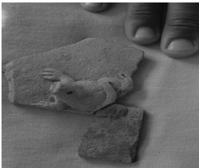
6. Aplicación zoomorfa de una vasija cerámica hallada por un niño en los alrededores de la comunidad Majagua

Actualmente manifiestan su enorme preocupación respecto a los daños que han sufrido estos lugares debido a la presencia de nuevos pobladores, especialmente no-indígenas, quienes no sólo se han apropiado de algunos lugares sino que también les han privado de la posibilidad de acceder a ellos o los han destruido para constituir sus asentamientos e implementar sus formas de aprovechamiento de la tierra en beneficio propio.