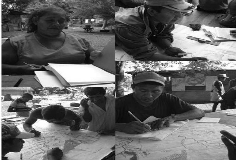
3. Indígenas Yabarana recopilando información para su autodemarcación territorial

Con este mismo propósito, tal como lo han hecho distintos grupos indígenas en el país han recurrido a la comunidad científica antropológica para solicitar el apoyo y el adiestramiento necesario para la recopilación de la información que avale su derecho ancestral sobre la tierra. Asimismo, han tenido la iniciativa de acercarse a los organismos gubernamentales y no gubernamentales para pedirles su apoyo y para exigirles especialmente que tomen acciones concretas ante las ocupaciones no indígenas (González, et al. , 2006).