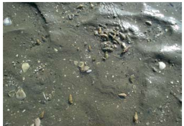
Figura 18. Baía do Araçá: gastrópode Cerithium atratum na região entremarés. Foto: A.C.Z. Amaral (07/2009).

Figure 15. Araçá Bay: burrow opening of the crab Uca , intertidal zone, mangrove vegetation near Pernambuco Island. Photo: A.C.Z. Amaral (07/2009).