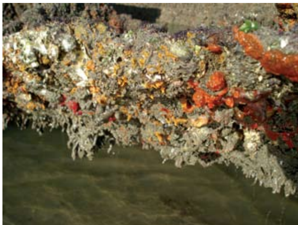
Figura 9. Baía do Araçá: costão rochoso da Ilha Pernambuco, zona inferior da região entremarés. Foto: A.C.Z. Amaral (07/2009).