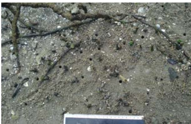
Figura 15. Baía do Araçá: aberturas de galerias do crustáceo Uca , região entremarés, núcleo de manguezal localizado próximo à Ilha Pernambuco. Foto: A.C.Z. Amaral (07/2009).

Figure 17. Araçá Bay: tube of the polychaete Diopatra aciculata in muddy sand flat, intertidal zone. Photo: A.C.Z. Amaral (07/2009).