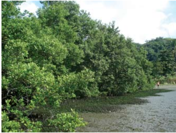
Figura 7. Baía do Araçá: vegetação do núcleo de manguezal localizado na parte superior da região entremarés. Foto: A.C.Z. Amaral (07/2009).