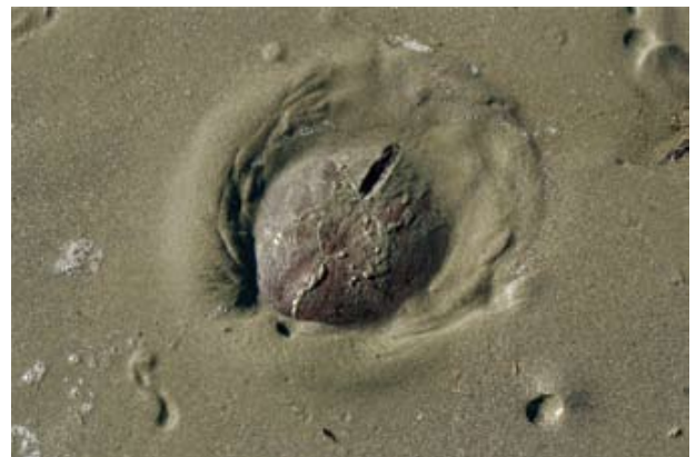
Figura 12. Baía do Araçá: bolacha-do-mar Encope emarginata em sedimento areno-lamoso, zona inferior da região entremarés. Foto: A.E. Migotto (07/2009).