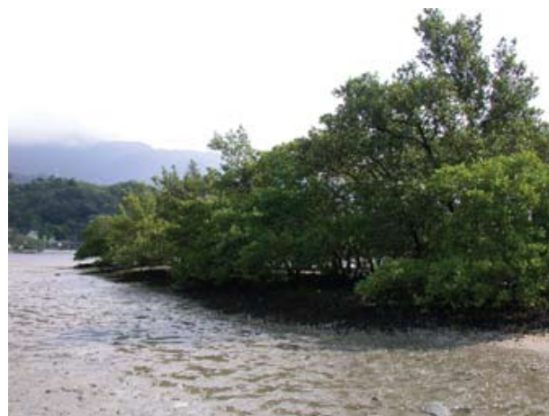
Figura 6. Baía do Araçá: núcleo de manguezal localizado na parte superior da região entremarés. Foto: S.A. Nallin (05/2009).