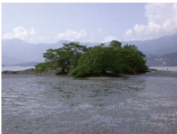
Figura 3. Baía do Araçá: vista geral do núcleo de manguezal localizado nas proximidades da Ilha Pernambuco. Foto: S.A. Nallin (05/2009).