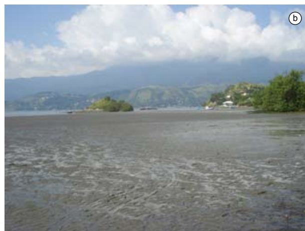
Figura 2. a-b) Baía do Araçá: região entremarés, fundo areno-lamoso.