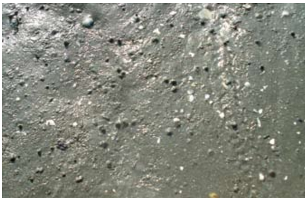
Figura 14. Baía do Araçá: dejetos na superfície do sedimento areno-lamoso que caracteriza a presença do poliqueta Laeonereis culveri . Foto: A.C.Z. Amaral (07/2009).

Figure 16. Araçá Bay: signs of the clam Macoma in muddy sand flat, intertidal zone. Photo: S.A. Nallin (05/2009).