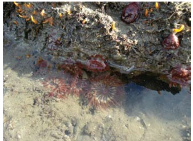
Figura 11. Baía do Araçá: costão rochoso da Ilha Pernambuco, em evidência anêmonas-do-mar Anemonia sargassensis . Foto: A.C.Z. Amaral (07/2009).