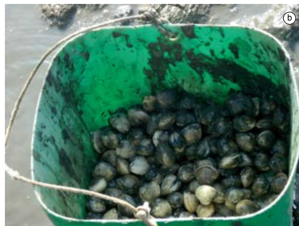
Figura 19. Baía do Araçá: a) caiçara coletando o berbigão Anomalocardia brasiliana em sedimento areno-lamoso na região entremarés; b) resultado da coleta de A. brasiliana em poucas horas de trabalho. Foto: A.C.Z. Amaral (07/2009).

Figure 19. Araçá Bay: a) a Caiçara (native inhabitants in the Southeastern coast of Brazil) hand digging the bivalve Anomalocardia brasiliana out of the muddy sand flat, intertidal zone; b) clams ( A. brasiliana ) hand caught in a few hours of work. Photo: A.C.Z. Amaral (07/2009).