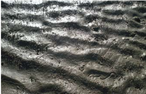
Figura 13. Baía do Araçá: pequenos tubos do crustáceo Kalliapseudes e marcas do gastrópode Olivella minuta em sedimento areno-lamoso na região entremarés.

Figure 13. Araçá Bay: small tubes of the crustacean Kalliapseudes , and sinuous trail marks of the gastropod Olivella minuta in muddy sand flat, intertidal zone.