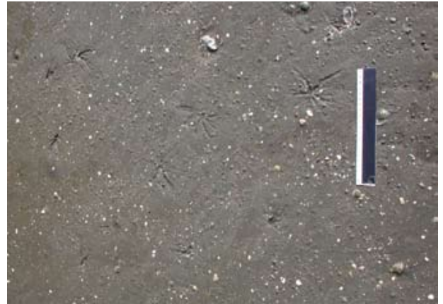
Figura 16. Baía do Araçá: marcas do bivalve Macoma em sedimento areno-lamoso na região entremarés. Foto: S.A. Nallin (05/2009).

Figure 13. Araçá Bay: small tubes of the crustacean Kalliapseudes , and sinuous trail marks of the gastropod Olivella minuta in muddy sand flat, intertidal zone. Photo: A.C.Z. Amaral (07/2009).