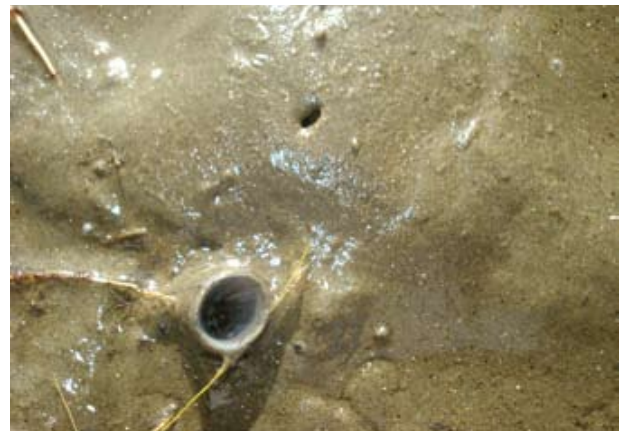
Figura 17. Baía do Araçá: tubo do poliqueta Diopatra aciculata em sedimento areno-lamoso na região entremarés. Foto: A.C.Z. Amaral (07/2009).

Figure 14. Araçá Bay: aggregates of fecal material on the surface of muddy sand bed produced by the polychaete Laeonereis culveri . Photo: A.C.Z. Amaral (07/2009).