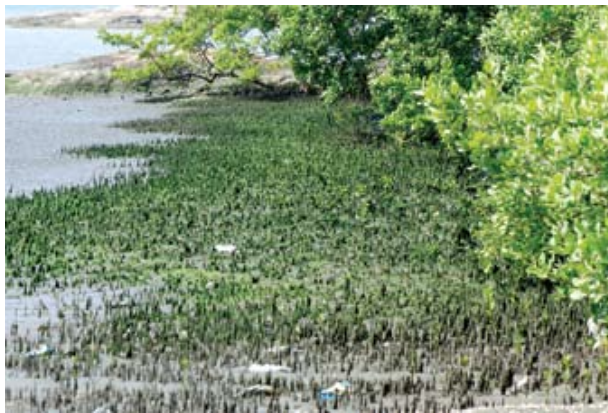
Figura 8. Baía do Araçá: detalhe do núcleo de manguezal localizado na parte superior da região entremarés. Foto A.E. Migotto (07/2009)