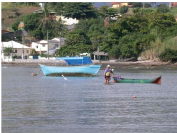
Figura 20. Baía do Araçá: pescadores locais retornando de uma pescaria na baía. (05/2009).

A composição da fauna e flora diz muito a respeito do grau de estabilidade ou perturbação de um ambiente. Muitas espécies só ocorrem em locais mais estáveis, enquanto outras, oportunistas, aproveitam espaços vazios disponibilizados na comunidade, após perturbações de diversas origens. As espécies oportunistas frequentemente indicam o estado de perturbação dos ambientes. Comunidades bentônicas, organismos que vivem sobre o substrato ou enterrados, têm sido utilizadas como uma das principais ferramentas para avaliação da qualidade ambiental.