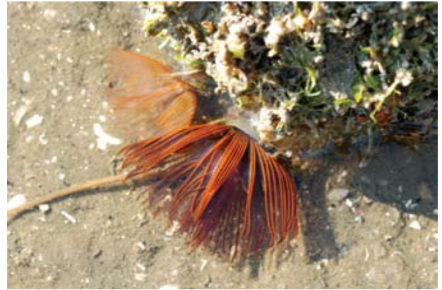
Figura 10. Baía do Araçá: costão rochoso da Ilha Pernambuco, em evidência poliquetas sabelídeos Branchiomma luctuosum . (07/2009).