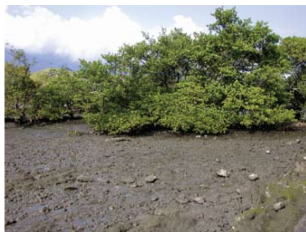
Figura 5. Baía do Araçá: interior do núcleo de manguezal localizado nas proximidades da Ilha Pernambuco. Foto: S.A. Nallin (05/2009).