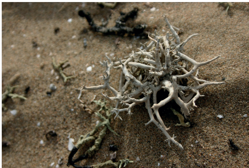
Figura Nº 2 Hábito de Santessonia cervicornis en Alto Patache

por el Consejo de Ministros para la Sustentabilidad y el Ministerio del Medio Ambiente de Chile en su XIII proceso de Clasificación de especies (MMA, 2017), de acuerdo al Reglamento de Clasificación de Especies de Chile (Decreto 29, MMA, 2012), convirtiéndola en una de las primeras especies de líquenes clasificadas en el país.