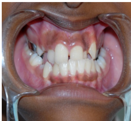
Fig. 1. Anomalia dentomaxilofacial de clase III (clasificación sindrómica de Moyers)

Se discutió el plan de tratamiento y se decidió utilizar el tornillo de expansión Hyrax. De este modo, se confeccionaron bandas en los primeros molares y premolares superiores, que no fueron cementadas para ser retiradas con una impresión y obtener un modelo de trabajo, en el cual se adaptó dicho tornillo.