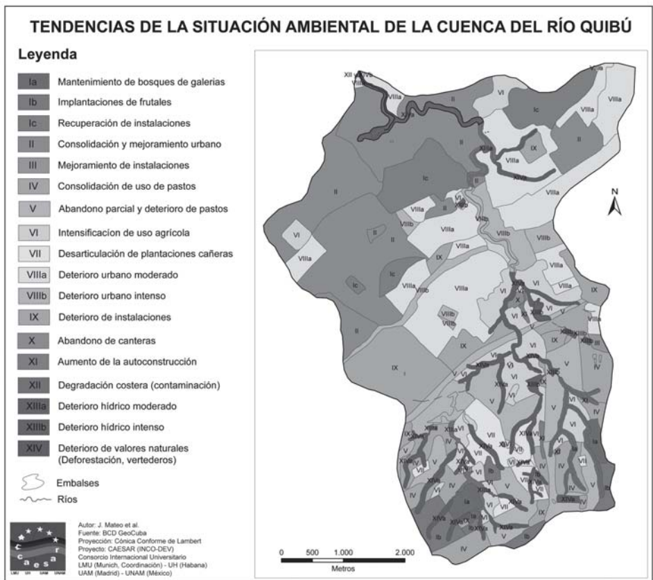
Figura 3 Tendencias actuales de las condiciones ambientales en las unidades geoecológicas y del paisaje en la cuenca del río Quibú

Sobre esta base se trata de identificar y cualificar la sostenibilidad ambiental y espacial, como punto de partida en las propuestas de ordenamiento y planificación ambiental que se pretenden diseñar. Siguiendo esta concepción, en la cuenca del Quibú, se han estudiado cuatro bloques fundamentales, partiendo del estudio de la estructura geoecológica, mediante la determinación de los paisajes naturales y culturales, el uso del territorio, y la formación de las unidades espaciales. El bloque del monitoreo ambiental, sustentado en un estudio hidrológico detallado, el análisis químico de muestras del agua del río en 10 estaciones durante dos años, y el análisis geoquímico de los suelos de unas 70 muestras permitió evaluar el estado geoecológico de la cuenca. El tercer bloque de trabajo se dedicó al análisis del comportamiento, la salud, la percepción ambiental, el nivel de cultura ambiental de la población y a las características demográficas basadas en una encuesta realizada a 1100 pobladores. El cuarto bloque fue la determinación de las características de la política ambiental, aplicada tanto a nivel de empresas, entidades de gobierno y a nivel de cuenca como un todo (figura 1).