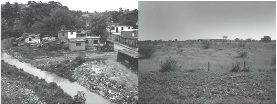
Figura 5 Contaminación de las aguas superficiales y asentamientos poblacionales informales en las márgenes del río (izquierda) y la dispersión de matorrales invasores en antiguas áreas de cultivo de caña de azúcar (derecha)