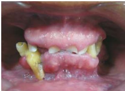
Fig. 1 Vista frontal

Posgrado de la Facultad de Estomatología de la Universidad Peruana Cayetano Heredia. Al examen clínico presenta 14 dientes con enfermedad periodontal y severo desgaste (Fig. 1,2,3).