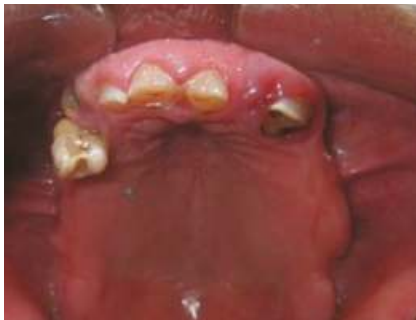
Fig. 2 Vista oclusal superior