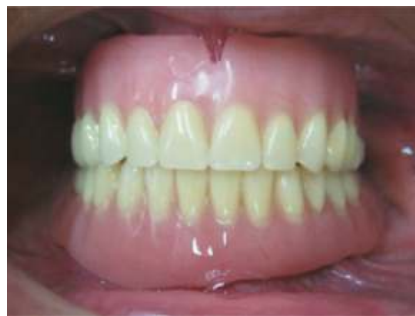
Fig. 12 Prótesis total inmediata instalada

regrese al siguiente día para su control (Fig. 11 y 12).