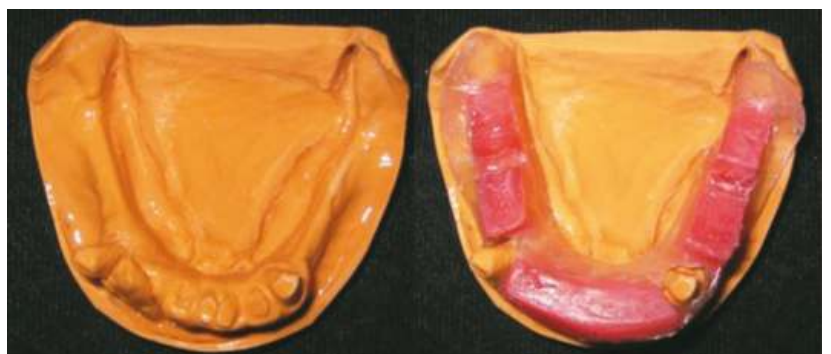
Fig. 7 Modelo definitivo inferior, placa base y rodete inferior