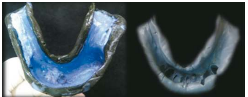
Fig. 5 Sellado periférico inferior e impresión definitiva inferior

Se realiza el encajonado y vaciado con yeso extraduro para confeccionar los modelos definitivos.