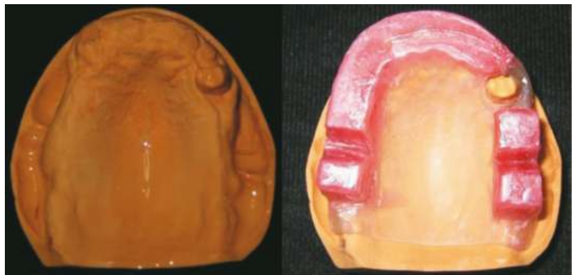
Fig. 6 Modelo definitivo superior, placa base y rodete superior

Sobre los modelos definitivos se fabrican las placas bases y los rodetes de oclusión (Fig. 6 y 7).