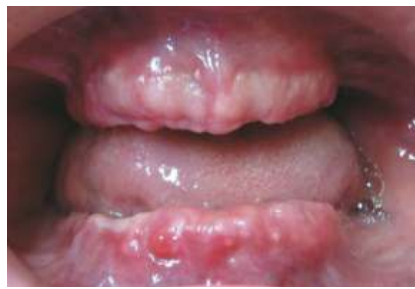
Fig. 11 Maxilares post-exodoncia

En los modelos remodelados se realiza el enfilado de dientes poli-planos y se procesa con acrílico rosado de termocurado para confeccionar la prótesis total. El día que se realiza en el paciente la exodoncia y remodelado óseo se cuenta con las prótesis totales confeccionadas. Al momento de su instalación se evalúa con cuidado la oclusión en relación céntrica y posiciones excéntricas. Se hacen las correcciones intrabucales y se realiza un rebasado con acondicionador de tejidos para compensar la discrepancia en el ajuste, garantizando la comodidad del paciente, la estabilidad y la retención. Se le indica al paciente que debe de usar la prótesis por 24 horas, esto es para que ocurra la cicatrización de acuerdo a la forma de la base de la dentadura. El mantenimiento de la prótesis debe ser explicada con minuciosidad y detenimiento, entregando de preferencia las indicaciones por escrito. Se le indica al paciente que coma alimentos blandos pero nutritivos y que