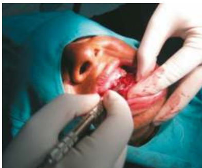
Fig. 10 Fase quirúrgica del remodelado