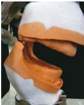
Fig. 9 Modelo con remodelado en articulador

Luego, en el modelo definitivo, se simula la extracción y remodelado óseo. Se construye una guía quirúrgica, la cual se utilizará en el momento de la extracción de los dientes, reduciendo la eliminación de hueso en exceso y mejorando la comodidad, retención y estabilidad