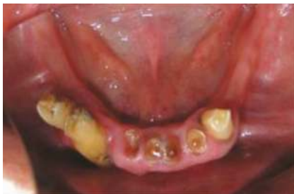
Fig. 3 Vista oclusal inferior

Se toma impresión con hidrocoloide reversible con una cubeta de stock para obtener un modelo primario. Se confecciona una cubeta individual sobre el modelo primario que está a 2 mm del fondo de surco, se utiliza cera base, a fin de proporcionar bloqueo en los socavados laterales al reborde residual y entre los dientes restantes. Luego se hace un sellado periférico con godiva y se toma la impresión definitiva con silicona mediana (Fig. 4 y 5).