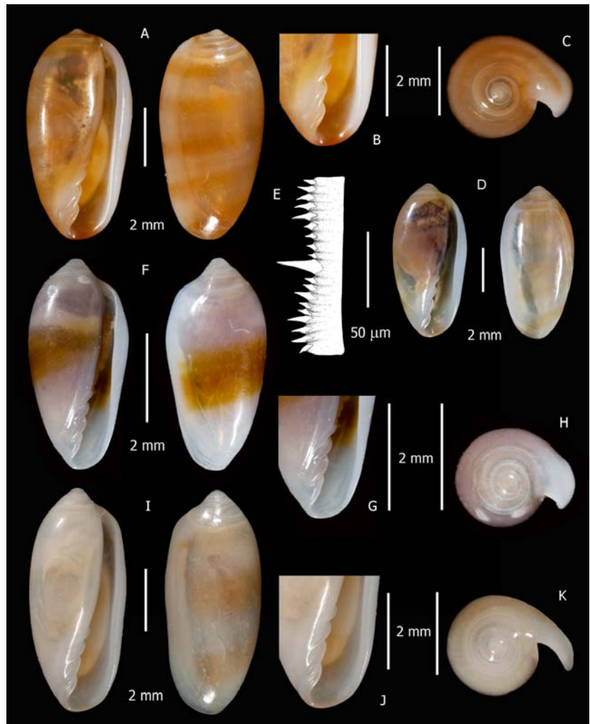
Figura 2. A-E) Volvarina morrocoyensis Caballer, Espinosa & Ortea, especie nueva, A-C. holotipo, D-E. paratipo 2, A. vista ventral y dorsal, B. detalle de los pliegues, C. protoconcha, D. vista ventral y dorsal, E. placa radular. F-H) Volvarina monchoi Caballer, Espinosa & Ortea, especie nueva, holotipo, F. vista ventral y dorsal, G. detalle de los pliegues, H. protoconcha. I-K) Volvarina avesensis Caballer, Espinosa & Ortea, especie nueva, holotipo, I. vista ventral y dorsal, J. detalle de los pliegues, K. protoconcha / A-E) Volvarina morrocoyensis Caballer, Espinosa & Ortea, new species, A-C. holotype, D-E. paratype 2, A. ventral and dorsal view, B. detail of the folds, C. protoconch, D. ventral and dorsal view, E. radular tooth. F-H) Volvarina monchoi Caballer, Espinosa & Ortea, new species, holotype, F. ventral and dorsal view, G. detail of the folds, H. protoconch. I-K) Volvarina avesensis Caballer, Espinosa & Ortea, new species, holotype, I. ventral and dorsal view, J. detail of the folds, K. protoconch

morrocoyensis , Caballer, Espinosa & Ortea especie nueva, puede ser comparada con Volvarina isabelae (Borro, 1946), descrita de la zona occidental de la costa norte de Cuba, con Volvarina yolandae Espinosa & Ortea, 2000, procedente de Manzanillo, en la costa caribeña de Costa Rica, Volvarina virginieae Espinosa & Ortea, 2012 y con Volvarina caballeri Espinosa & Ortea, 2012, ambas de la isla de Guadalupe. V. isabelae es de tamaño más pequeño (holotipo: 4,3 x 2,4 mm), con la espira corta y ampliamente redondeada (Borro 1946), lo que le confiere una forma muy diferente a la concha. V. yolandae , aunque es de tamaño similar (6,4 mm de largo), es comparativamente más alargada y estrecha, con sólo 2,5 mm de ancho; además tiene la espira más ancha y redondeada y presenta una marcada sinuosidad en casi todo el labio palatal. Adicionalmente, los pliegues columelares de ambas especies también son diferentes a los de esta nueva