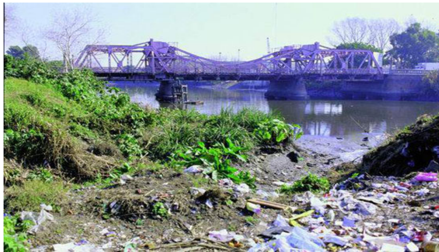
Figura 1. Típico aspecto del Riachuelo. Las aguas oscuras cargadas de residuos orgánicos, derivados del petróleo, cientos de tóxicos y escasas en oxígeno no permiten el desarrollo de una fauna y flora normal.

Biorremediación puede definirse como la respuesta biológica al abuso ambiental (Levin y Gealt, 1997). Esta definición permite distinguir entre el uso de microorganismos para recuperar áreas contaminadas y para tratamientos de residuos tanto industriales como domiciliarios (Madigan et al. , 2003; Eweis et al. , 1999; Nemerov y Dasgupta, 1998). Distintas situaciones de abuso ambiental pueden observarse en las Figuras 1, 2 y 3 .