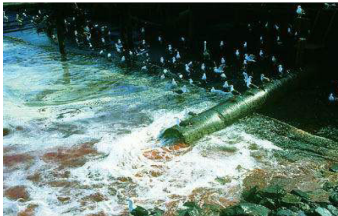
Figura 2. Descarga directa, sin pre-tratamiento, de los residuos orgánicos originados en una empresa cárnica (frigorífico). Foto