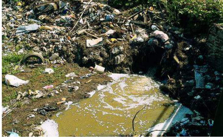
Figura 3. Arroyo Bonaerense. Se observa la acumulación de basura luego de una crecida; la espuma indica la presencia de detergentes en el agua.

Es necesario establecer previamente cuáles son los niveles de contaminación que pueden ser admitidos en un ecosistema sin que por ello se provoquen daños a los seres vivos que viven en él (Moreno, 2003; Collie y Donnelly, 1997). En este sentido debe tenerse en cuenta el destino del área que desea descontaminarse. Por ejemplo, en el caso de un ecosistema acuático, deberá definirse cuáles serán los usos que tendrán esas aguas: pueden ser destinadas a producir agua potable, para usos de recreación (balnearios), empleadas en agricultura o ganadería, como reserva biológica u otros usos. El objetivo de la biorremediación es eliminar, o al menos disminuir la concentración de sustancias potencialmente tóxicas, dispersadas accidentalmente o no en suelos y/o cuerpos de agua superficial o subterránea, utilizando como parte fundamental del proceso a los microorganismos (Alexander, 1994).